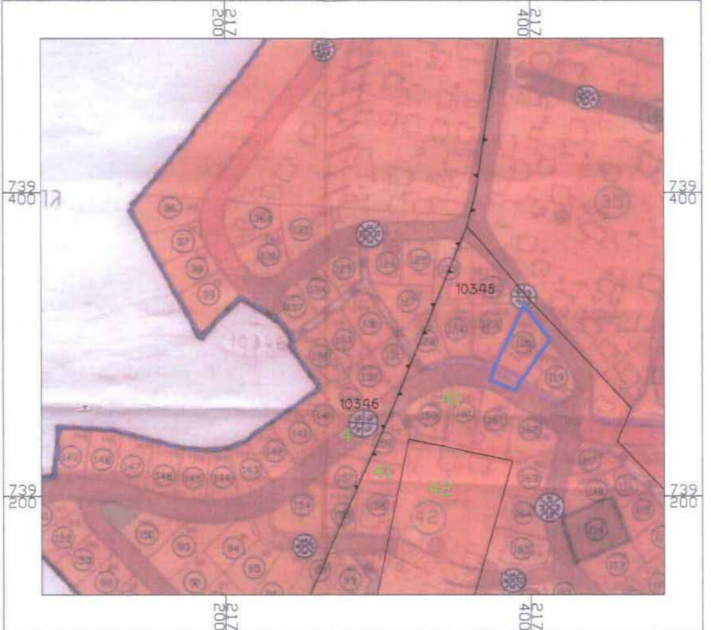
תרשים סביבה קנ"מ 1:2500 (על רקע ת"מ 6847/ג)