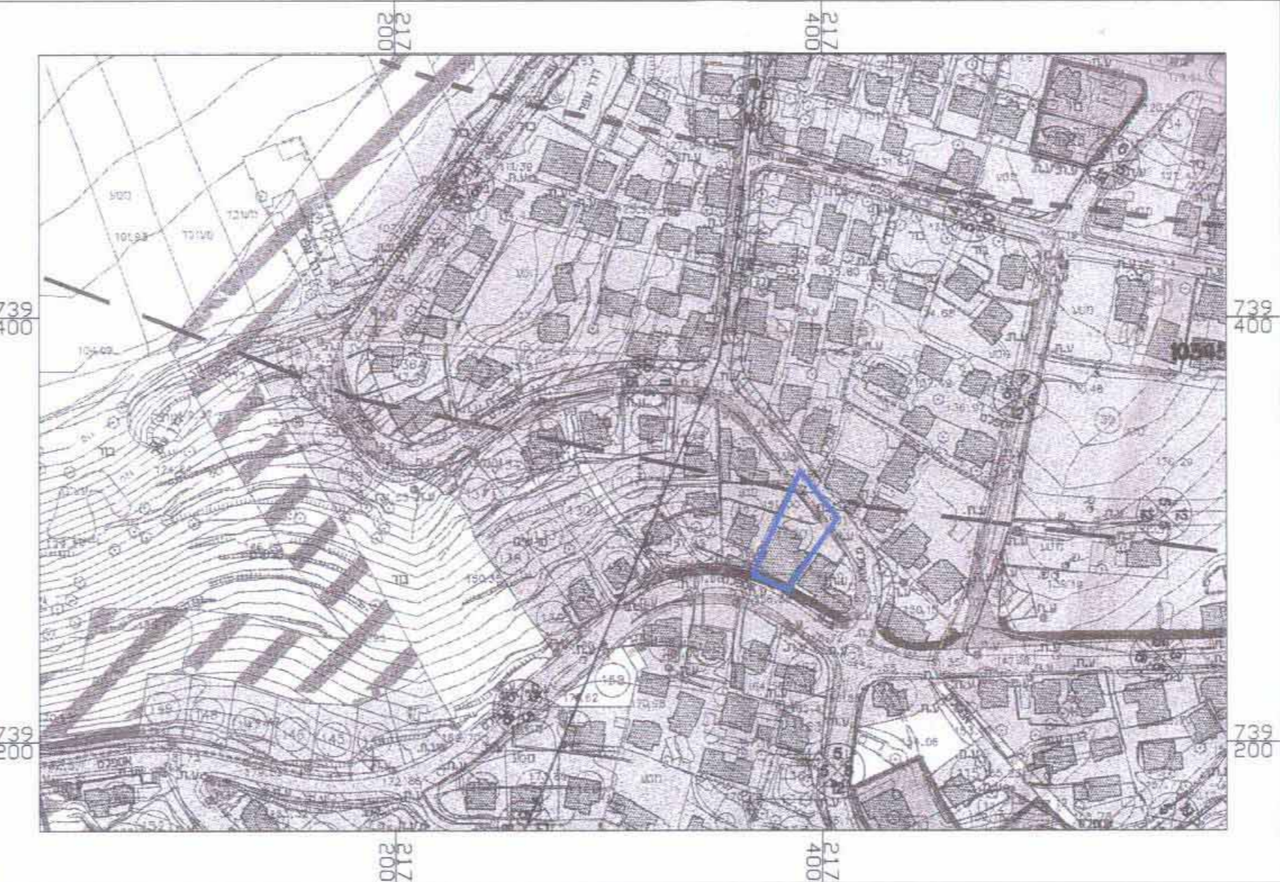
תרשים סביבה קנ"מ 1:2500 (על רקע ת"מ מופקדת ג/13164)