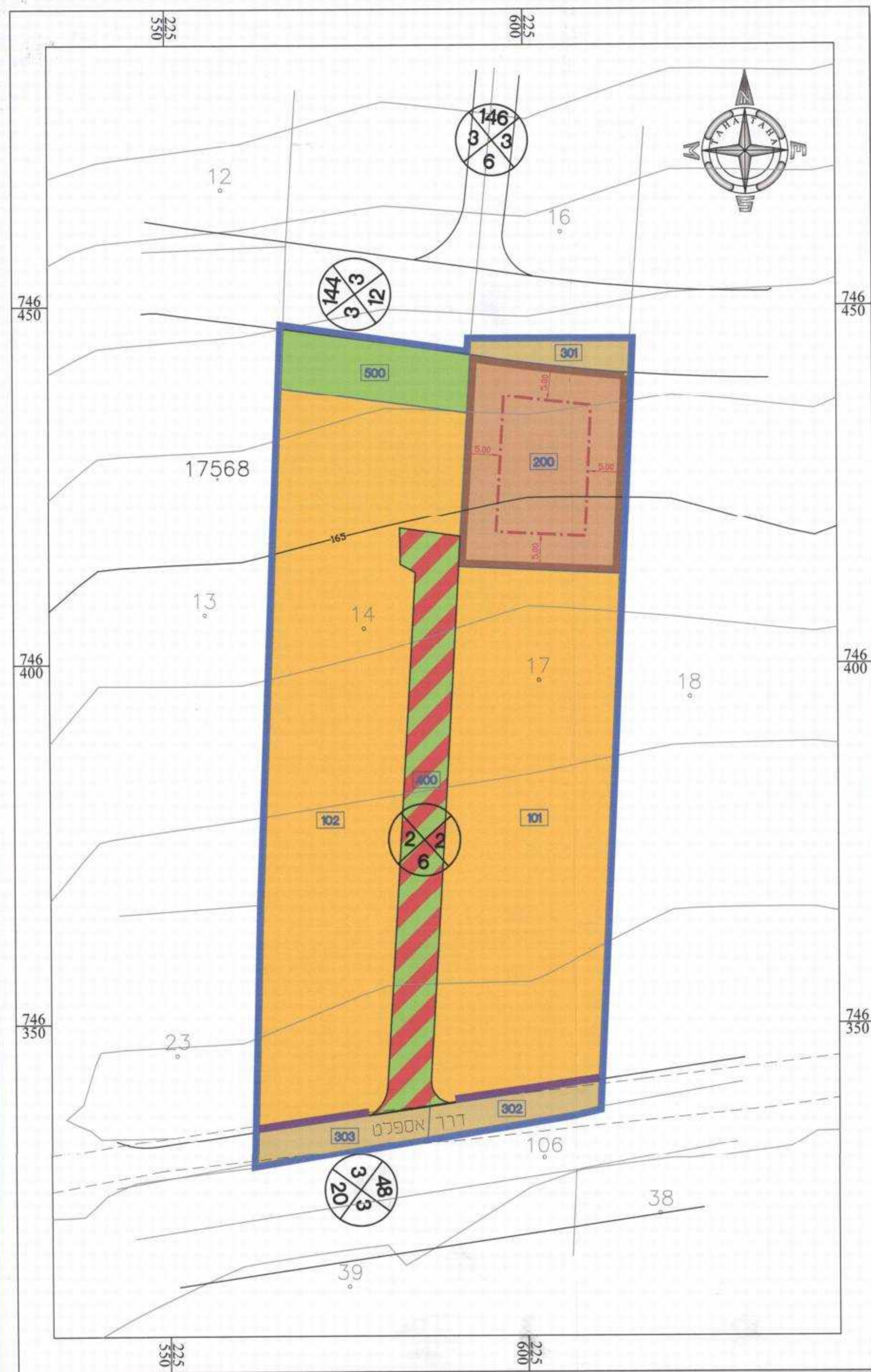
מצב מוצע קנ"מ 1:500