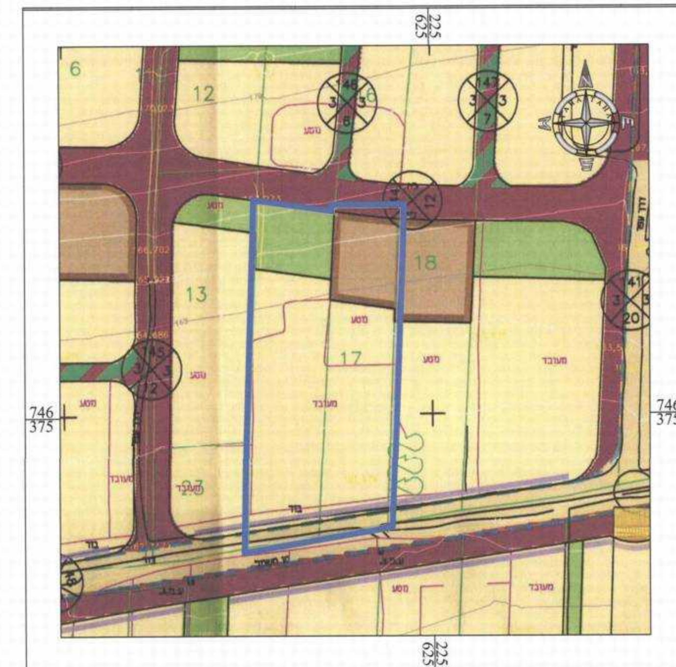
תרשים סביבה קנ"מ 1:1250 עפ"י תכנית מס' 12784/ג

תאריך מדידה : 13/10/2010 תאריך עדכון 1 : 13/12/2011 תאריך עדכון 2 : תאריך עדכון 3 : חתימת וחותמת המודד :