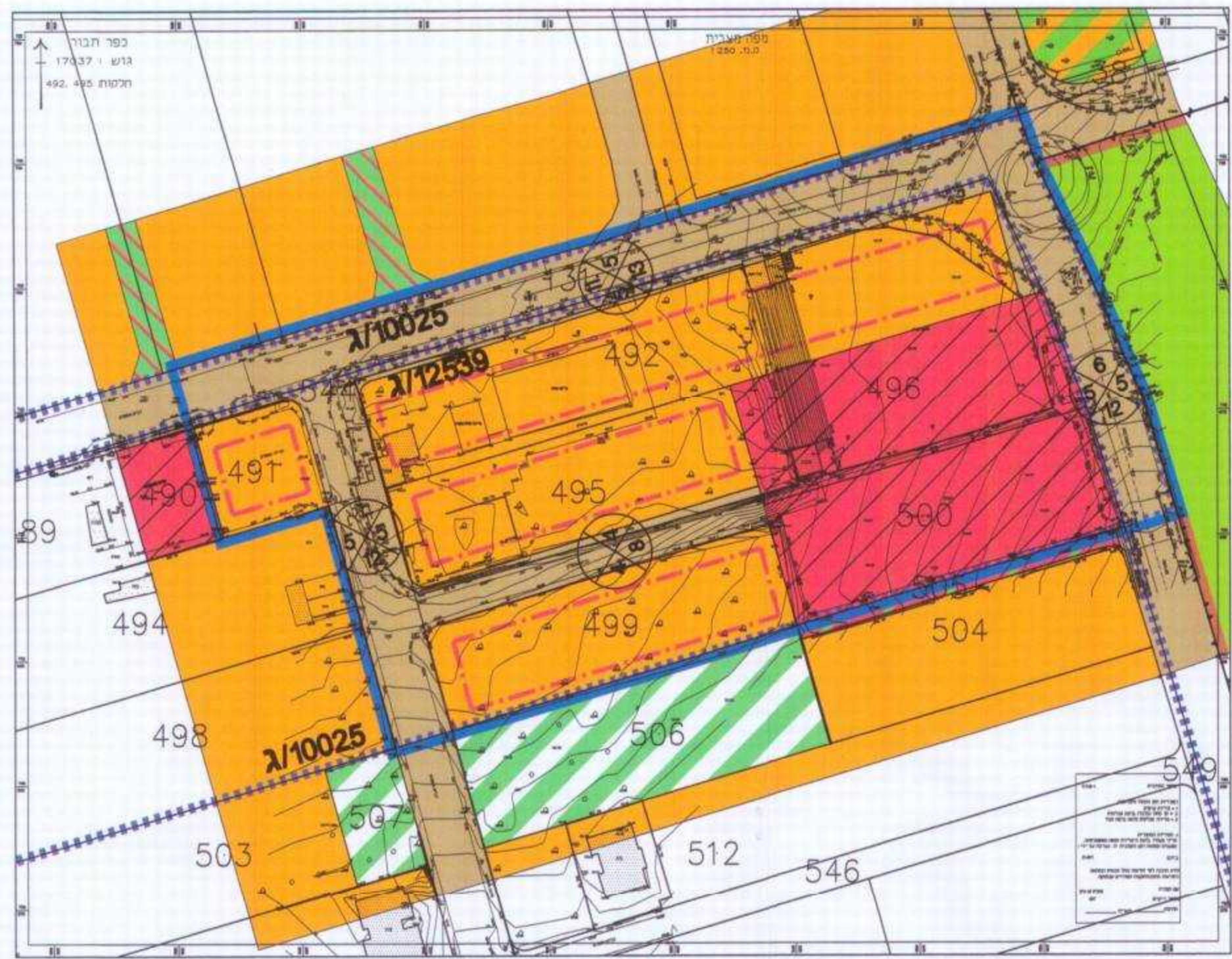
מצב מאושר קנ"מ 1000 : 1