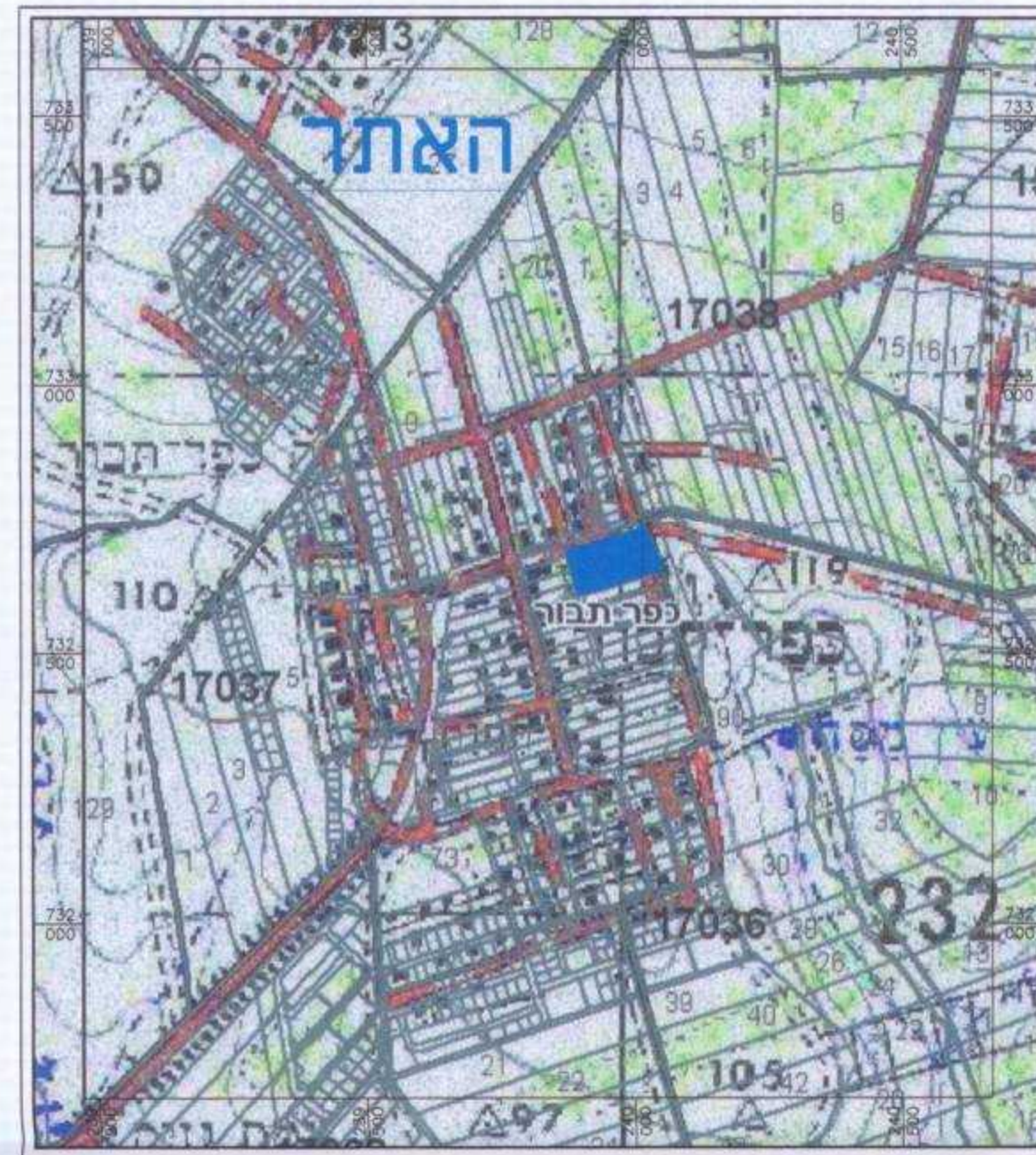
תרשים סביבה קנ"מ 12500 : 1