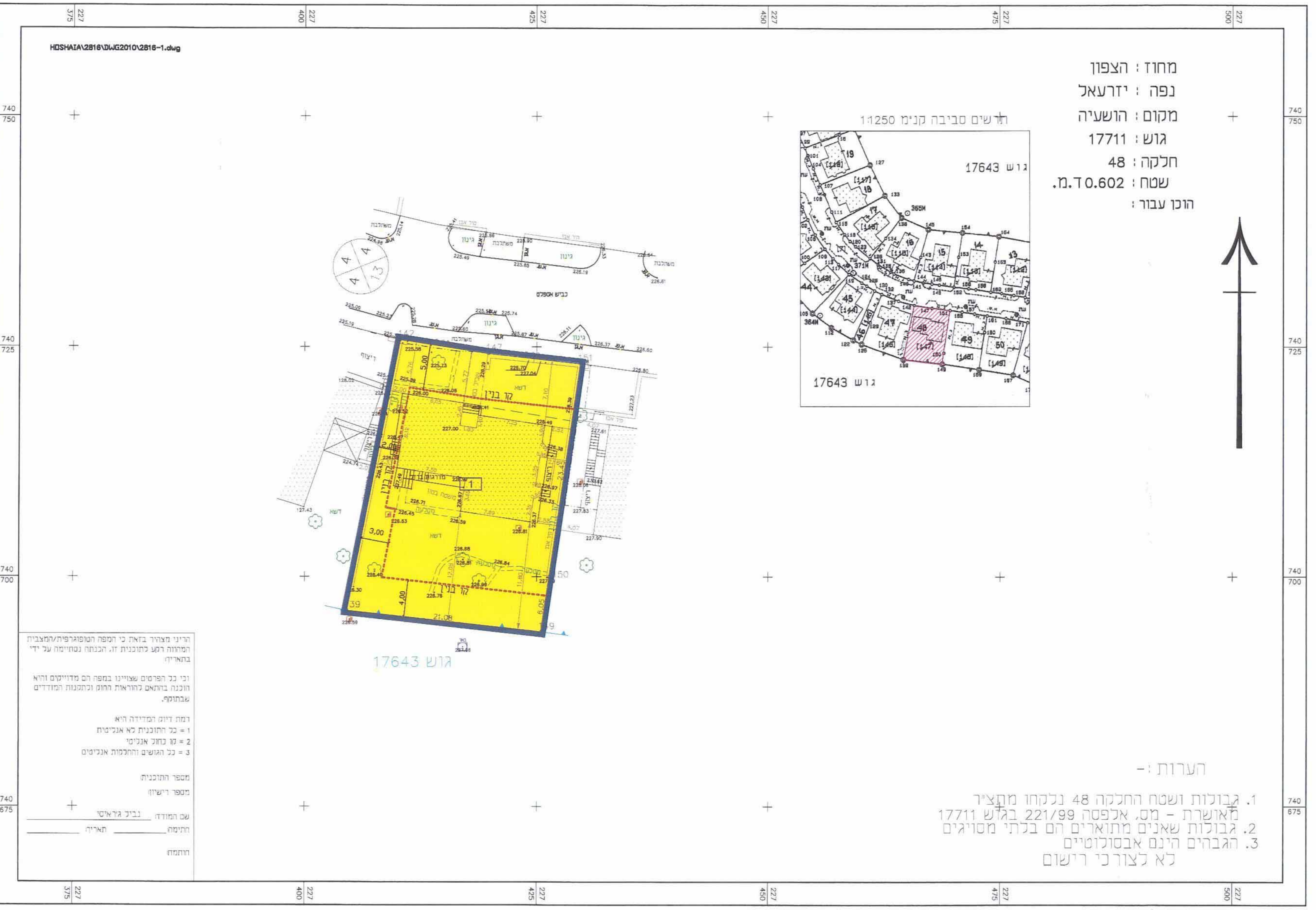
מצב מוצע ק.מ. 1:250

הודעה מס' 101/2023 פורסמה בלשון הרשמיים של הרשות המקומית מס' 101/2023 תאריך: 28.09.2023