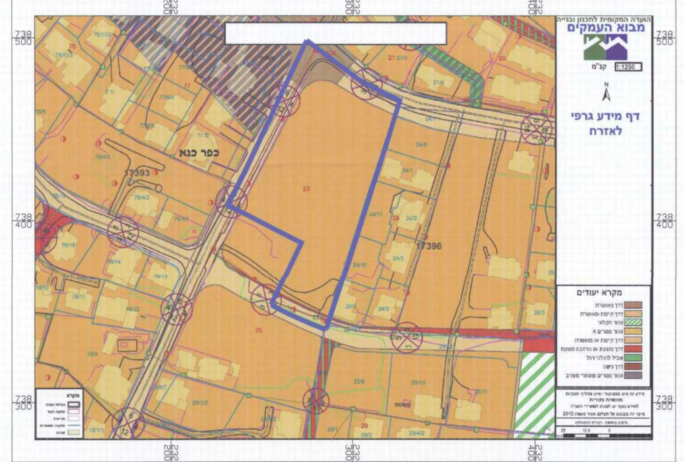
תרשים סביבה קנ"מ 1:1250