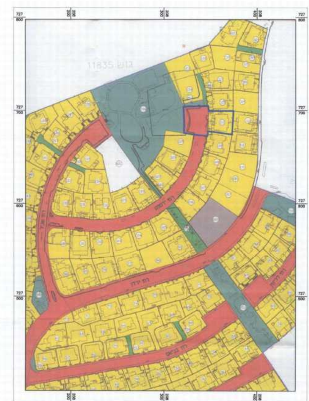
תרשים סביבה קנ"מ 1:2500 לפי תכנית 21\14\2 המאושרת