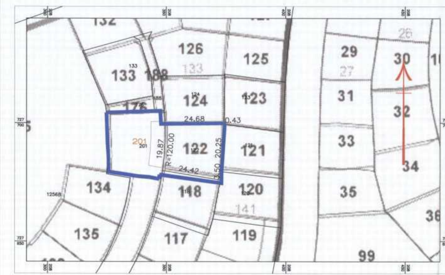
תרשים סביבה קנ"מ 1:1000