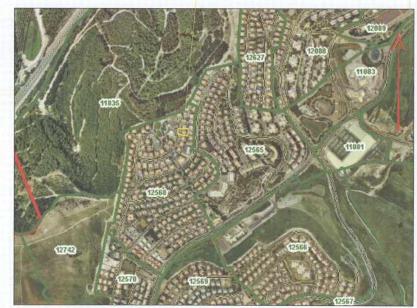
תרשים סביבה קנ"מ 1:1250