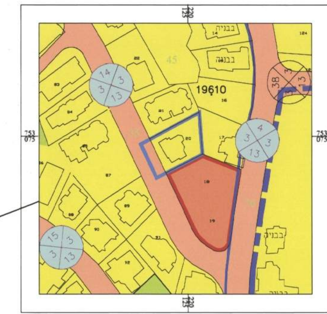
תכנית הסביבה קנ"מ: 1:250 לפי גאולוס 16001 המופקדת