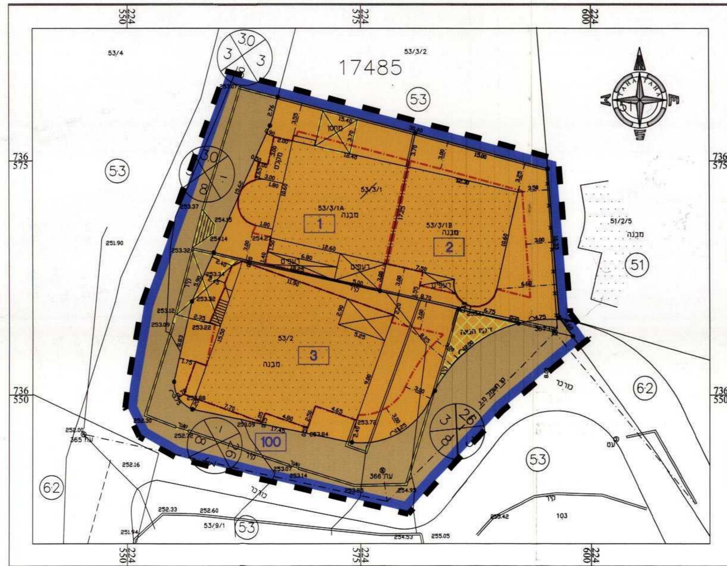
מצב מוצע קני"מ 1:250