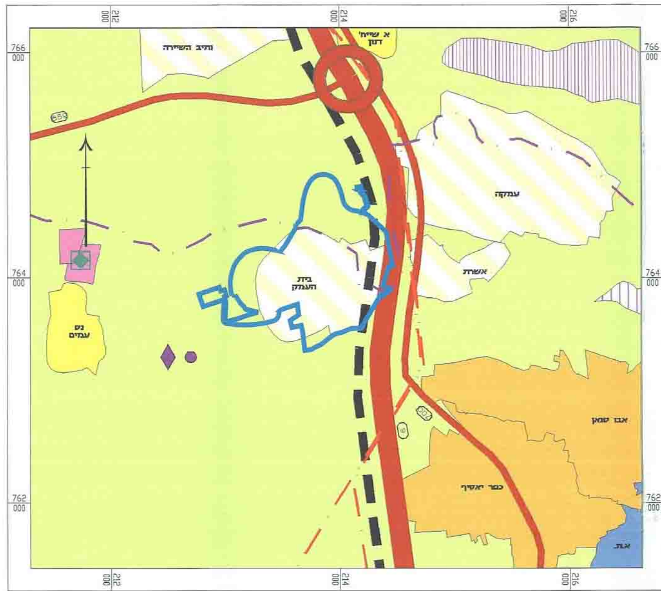
תרשים סביבה לפי תמ"א 9 קנ"מ 1 : 20,000