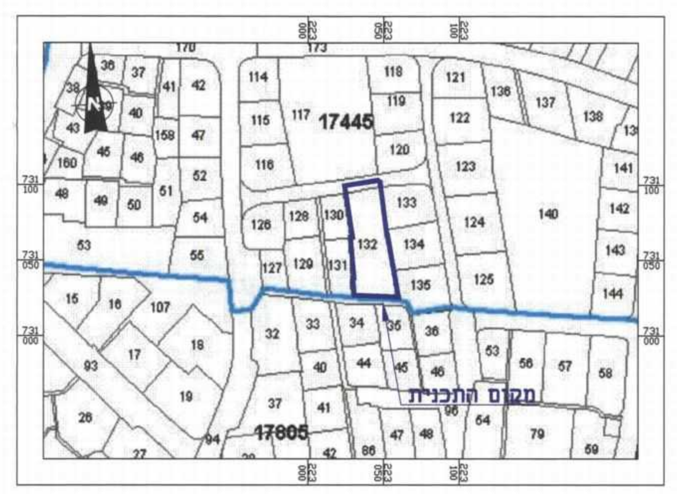
גושים חלקות קנ"מ 1:2500