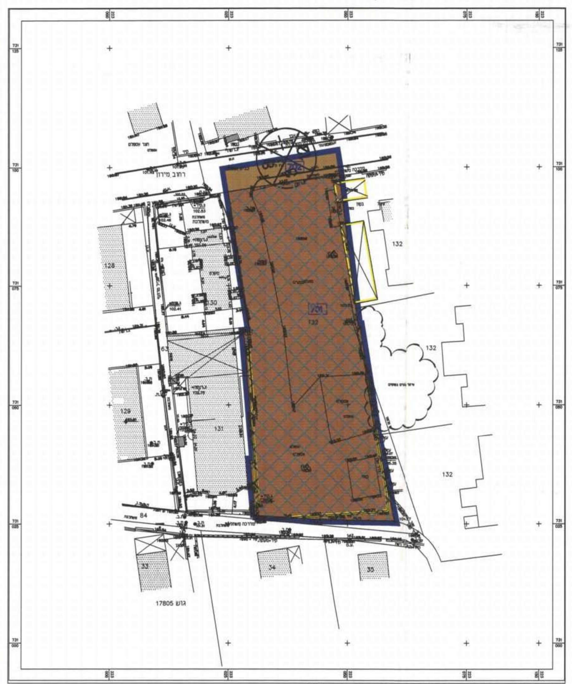
תכנית מצב מוצע קנ"מ 1:500