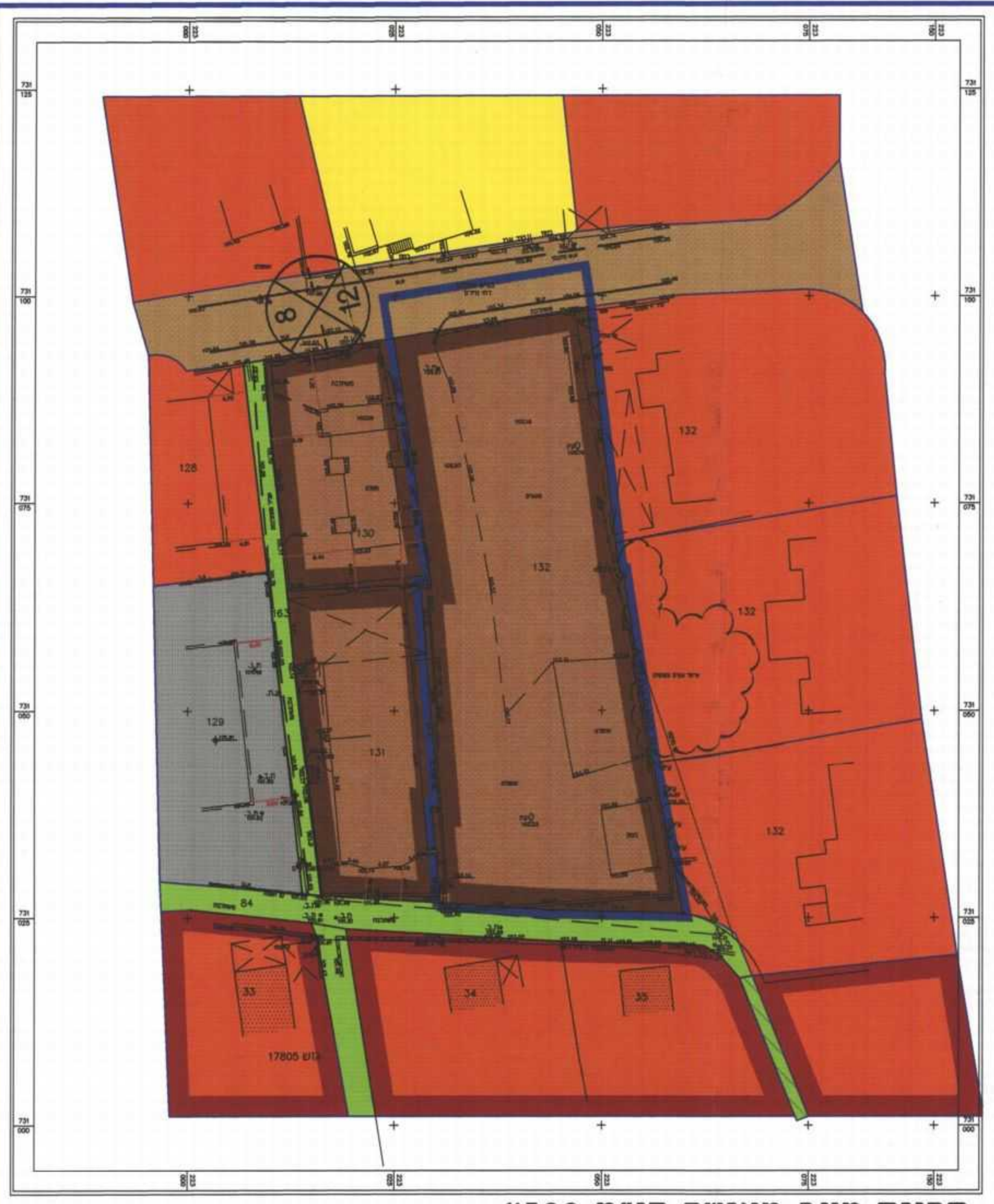
תכנית מצב מאושר קנ"מ 1:500

הריני מצרף בזאת כי מדירת המפה הטופוגרפית/המצבית המוצגת בקובץ התכנית זו, וערכה על ידי בוס ודיא הוכנה לפי הוראות טוהא מבית ברתאם להוראות החוק והחלטת המודדים 11/3/2014 תחתי ג'ראסי נביל 806 מספר רישון חתימה 22.06.2014 תאריך