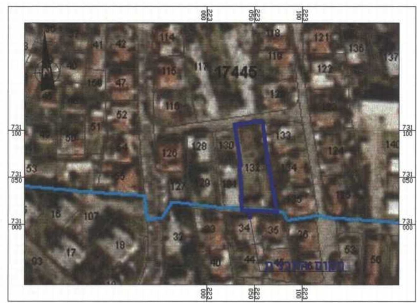
אורטופוטו, קנ"מ 1:2000