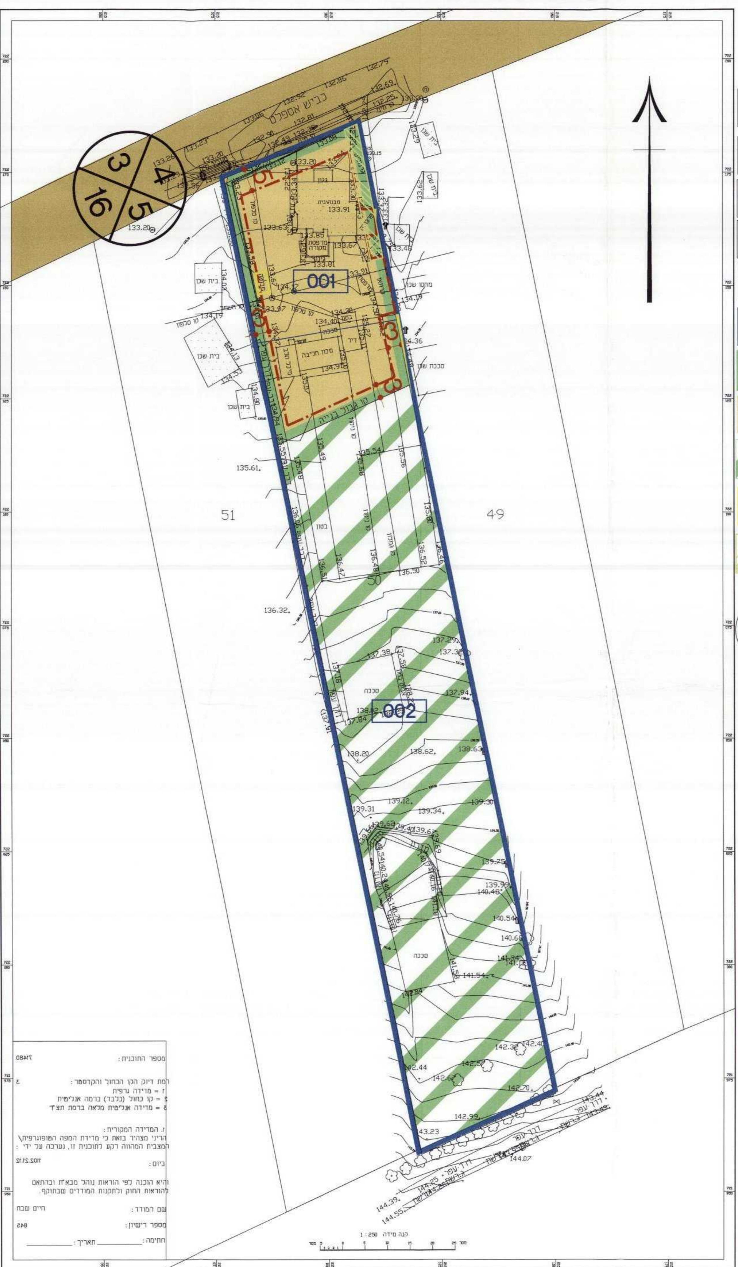
מצב מוצע ק.נ.מ. 1:500

מספר התוכנית: 08417 רמת דיוק הקו הכחול והקדסטה: 1 = מדידה גרפית 2 = קו כחול (נכבד) ברמה אנישית 3 = מדידה אנישית מכאה ברמת תצד 1. המדידה המקורית 2. ריני מצורף בואת כי מדידת המפה הטופוגרפית המצבית המהווה רקע לתוכנית זו. וערכה על ידי: ביום: 21.12.2011 והיא הוכנה לפי הוראות נוהל מאיז ובתחום להוראות החוק ולתקנות המודדים שבתוקף. שם המודד: _____ מספר רישיון: _____ חתימה: _____ תאריך: _____