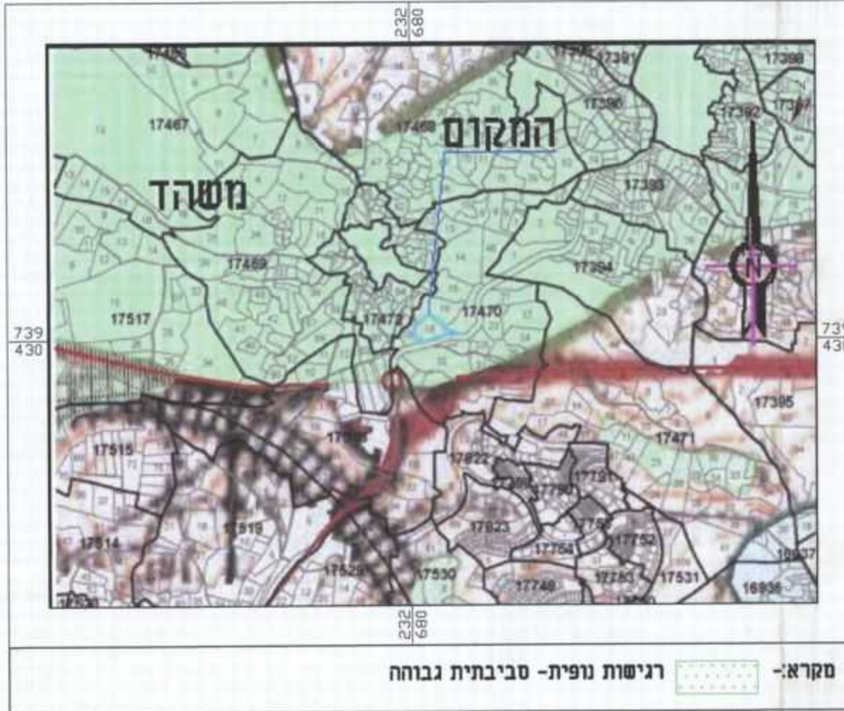
מקרא: רגישות נופית- סביבתית גבוהה