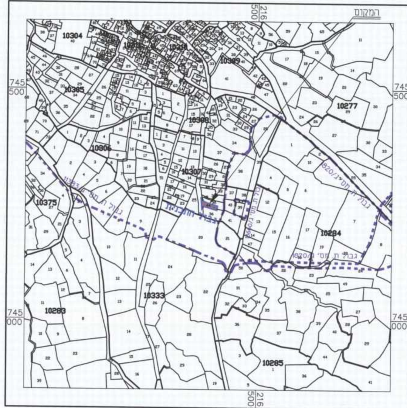
תרשים סביבה קני"מ 1 : 5,000