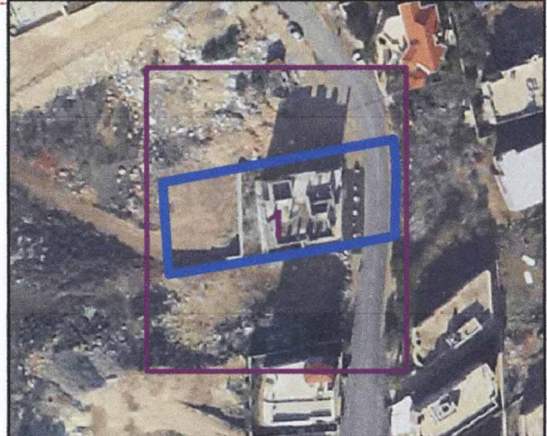
שנת צילום אוויר: 2014/2012 גרסת מערכת 02.2012