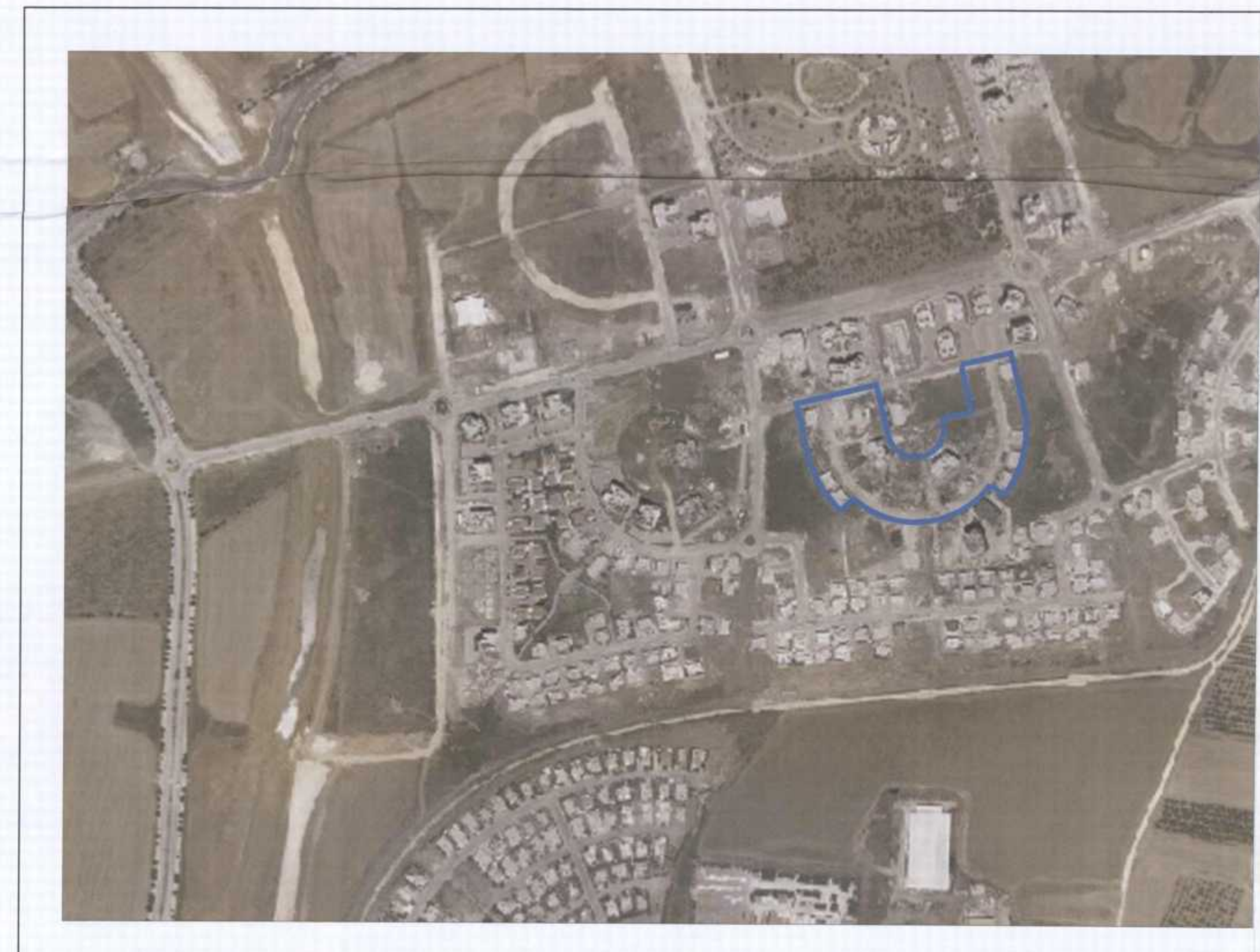
תרשים סביבה קנ"מ 1:5,000