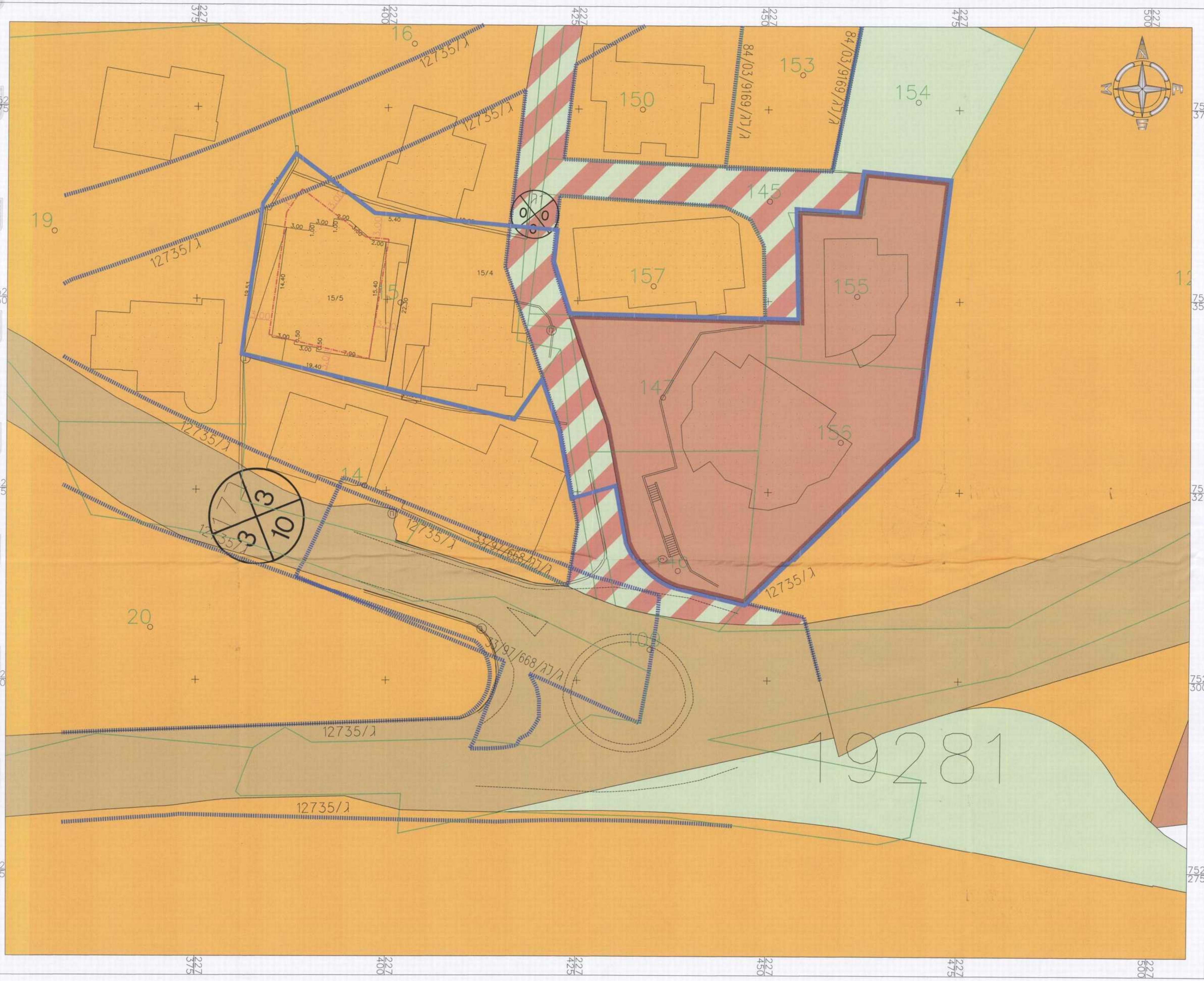
מצב מאושר קני"מ 1:250