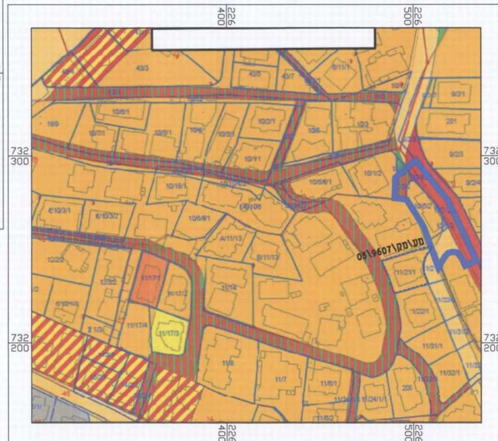
תרשים סביבה קנ"מ 1:1250

חוק התכנון והבנייה, התשכ"ה - 1965 תכנית מפורטת