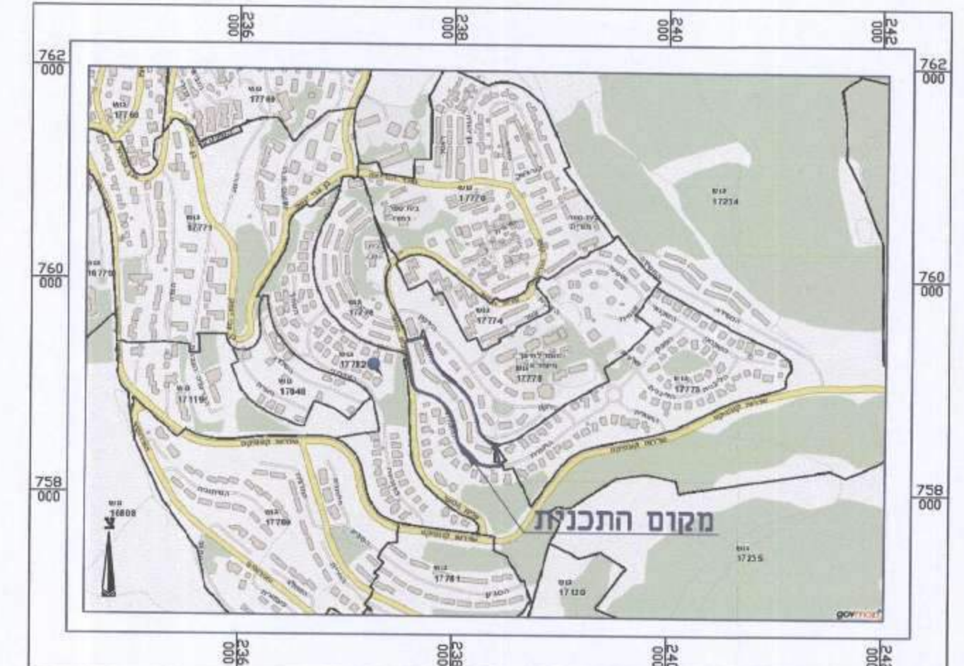
תרשים סביבה כללי קנ"מ 1:10,000