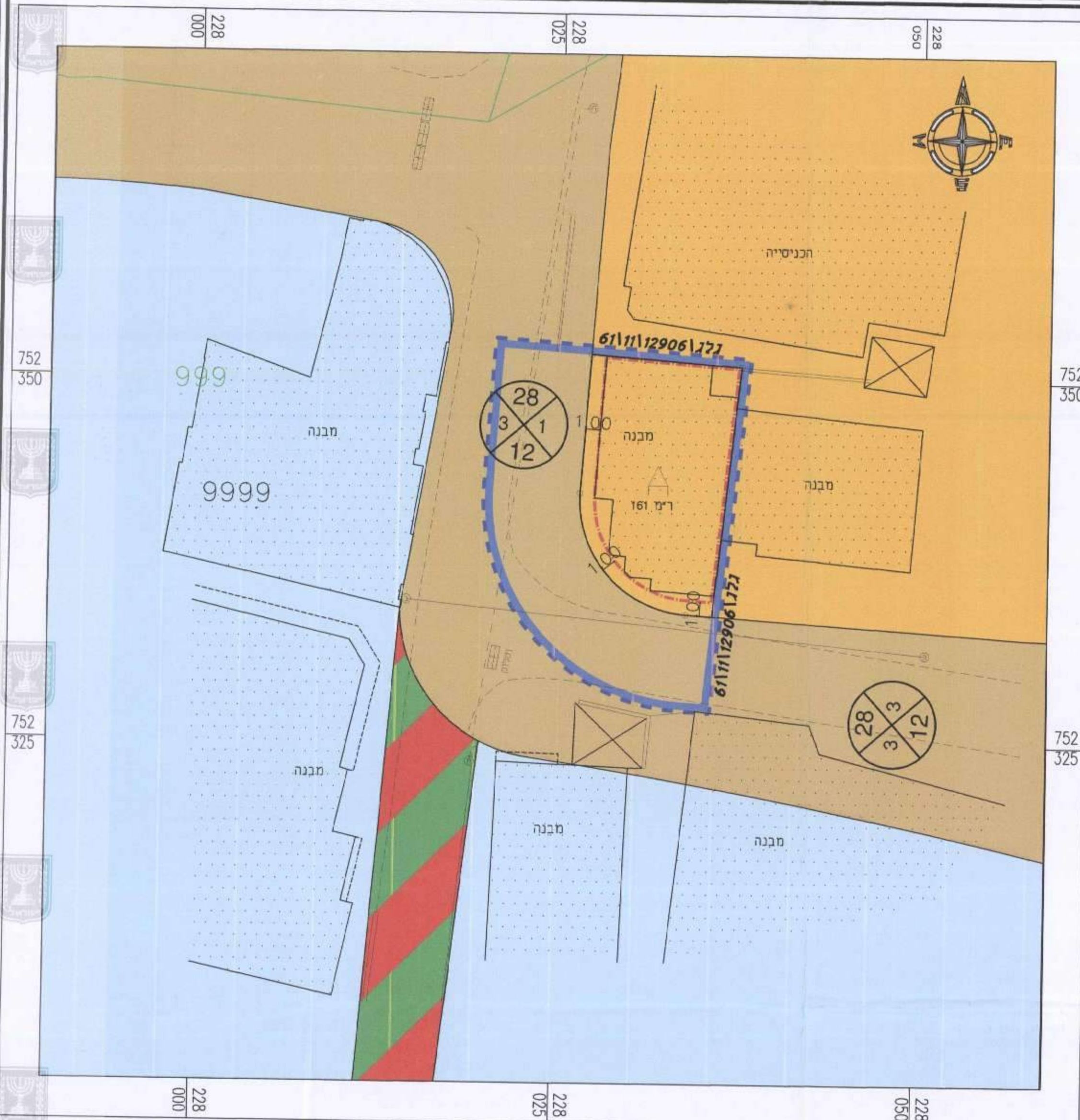
מצב מאושר קני"מ 1:250