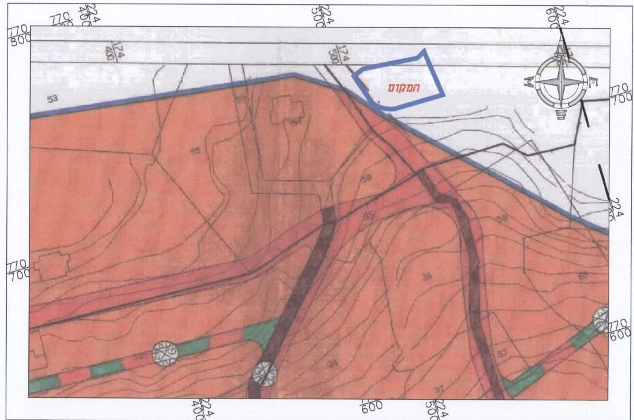
תרשים סביבה עפ"י ג' 6296/1 קני"מ 1:1000

חוק התכנון והבניה, התשכ"ה - 1965 תכנית מפורטת