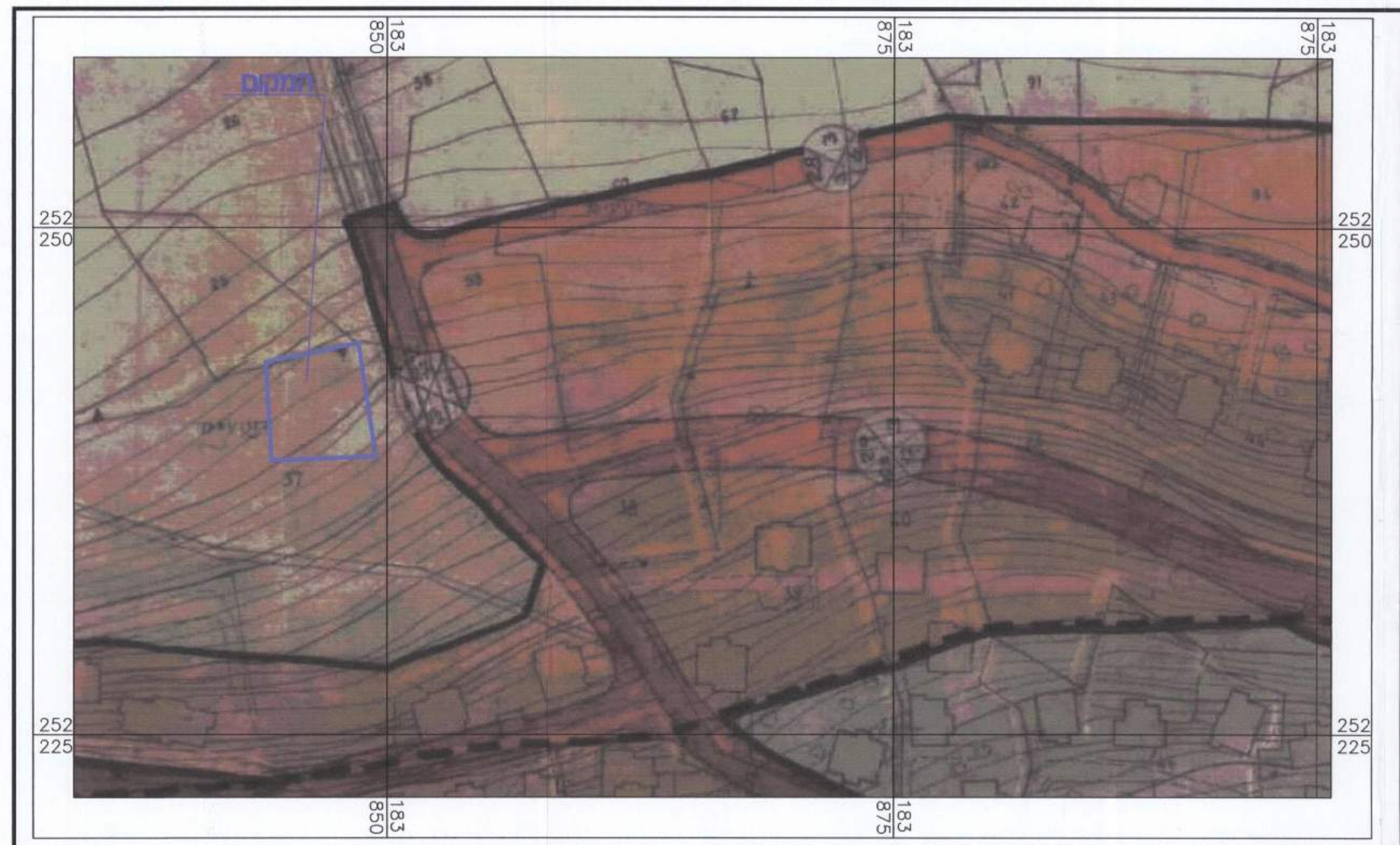
תרשים סביבה קנ"מ 1:10000