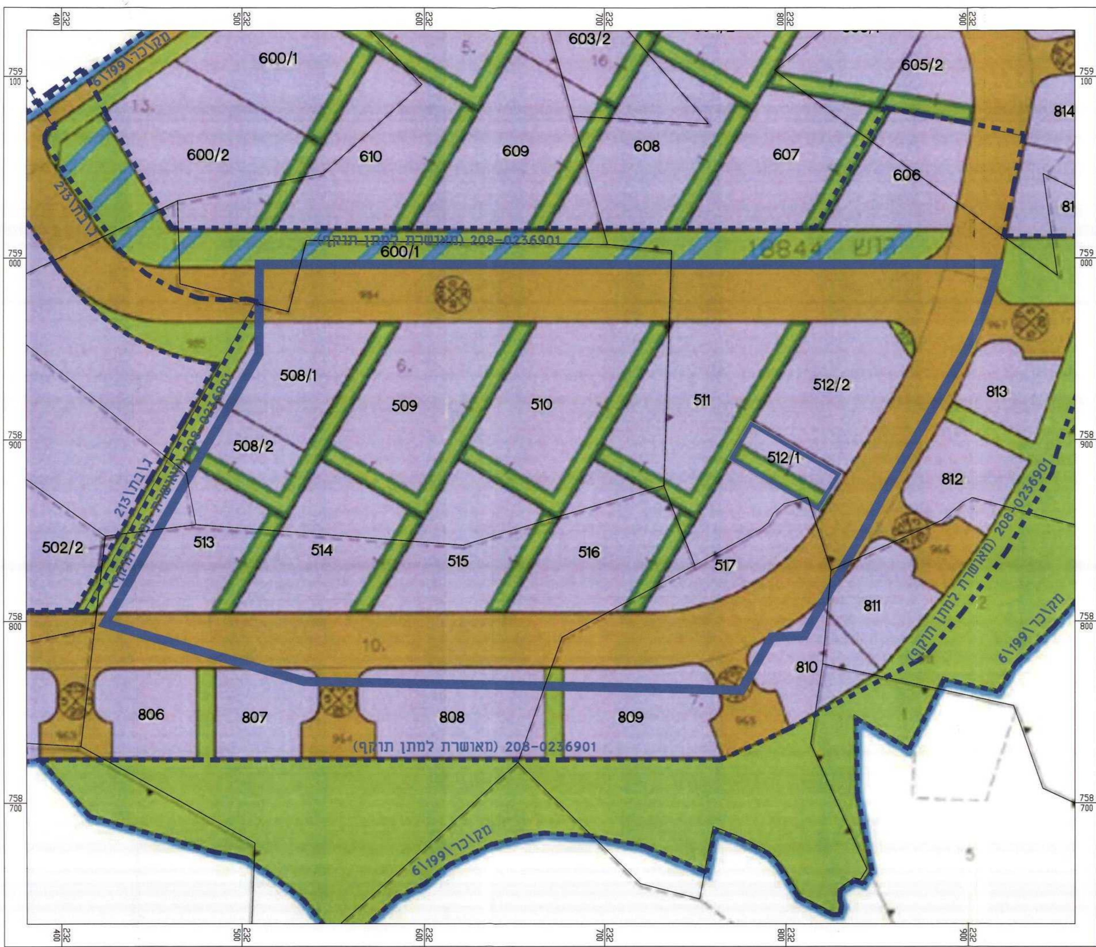
מצב מאושר 1:1250