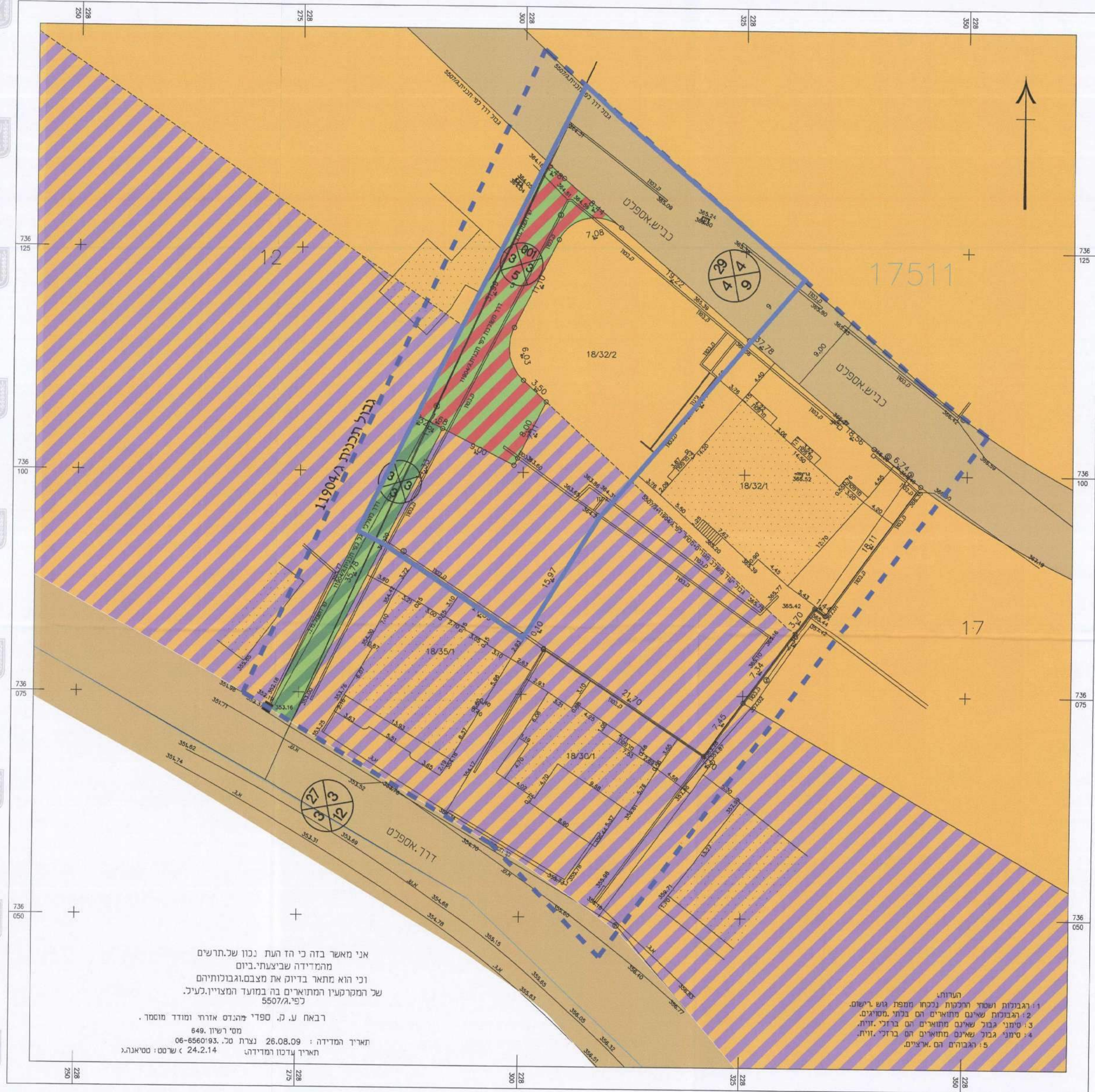
מצב מאושר קנ"מ 1:250

אני מאשר בזה כי זה העת נכון של תרשים מהמדידה שביצעתי. ביום וזי הוא מתאר בדיוק את מצבם ובולותיהם של המקרקעין המוצגים בה במועד המצויין לעיל. כ"פ/5507