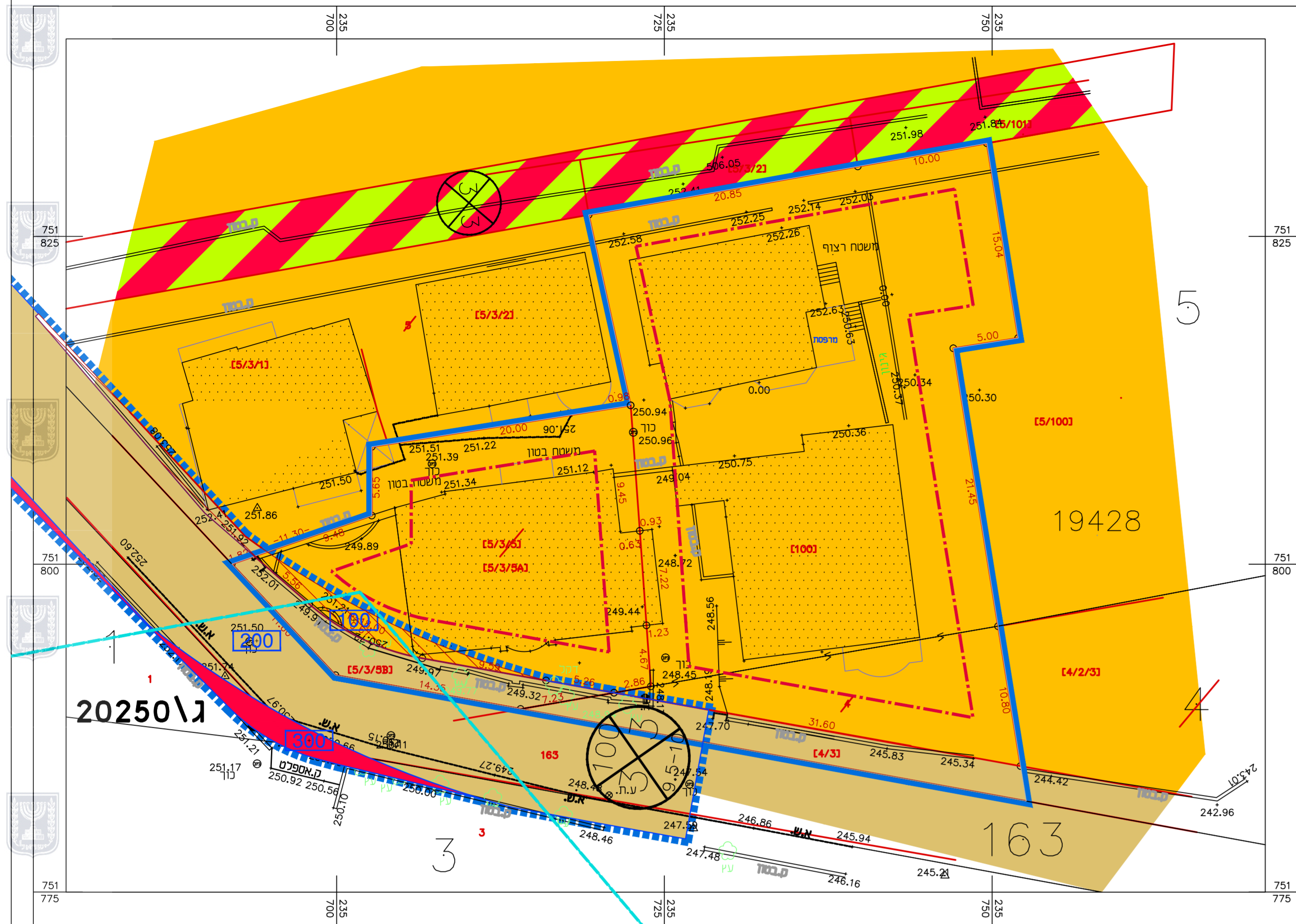
מצב קיים : קנ"מ 1:250