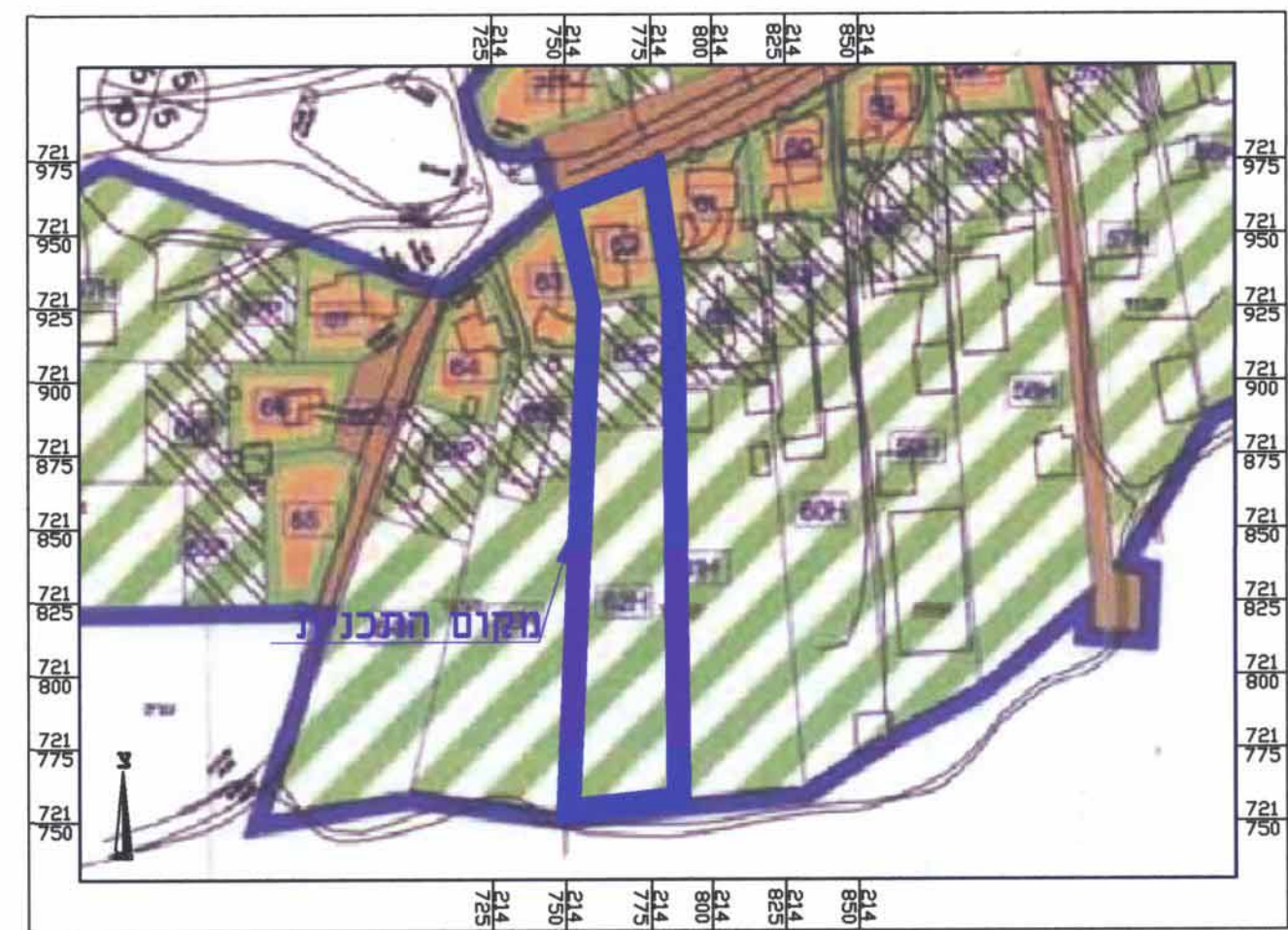
תרשים מתוך תכנית מאושרת קני"מ 1:2'500