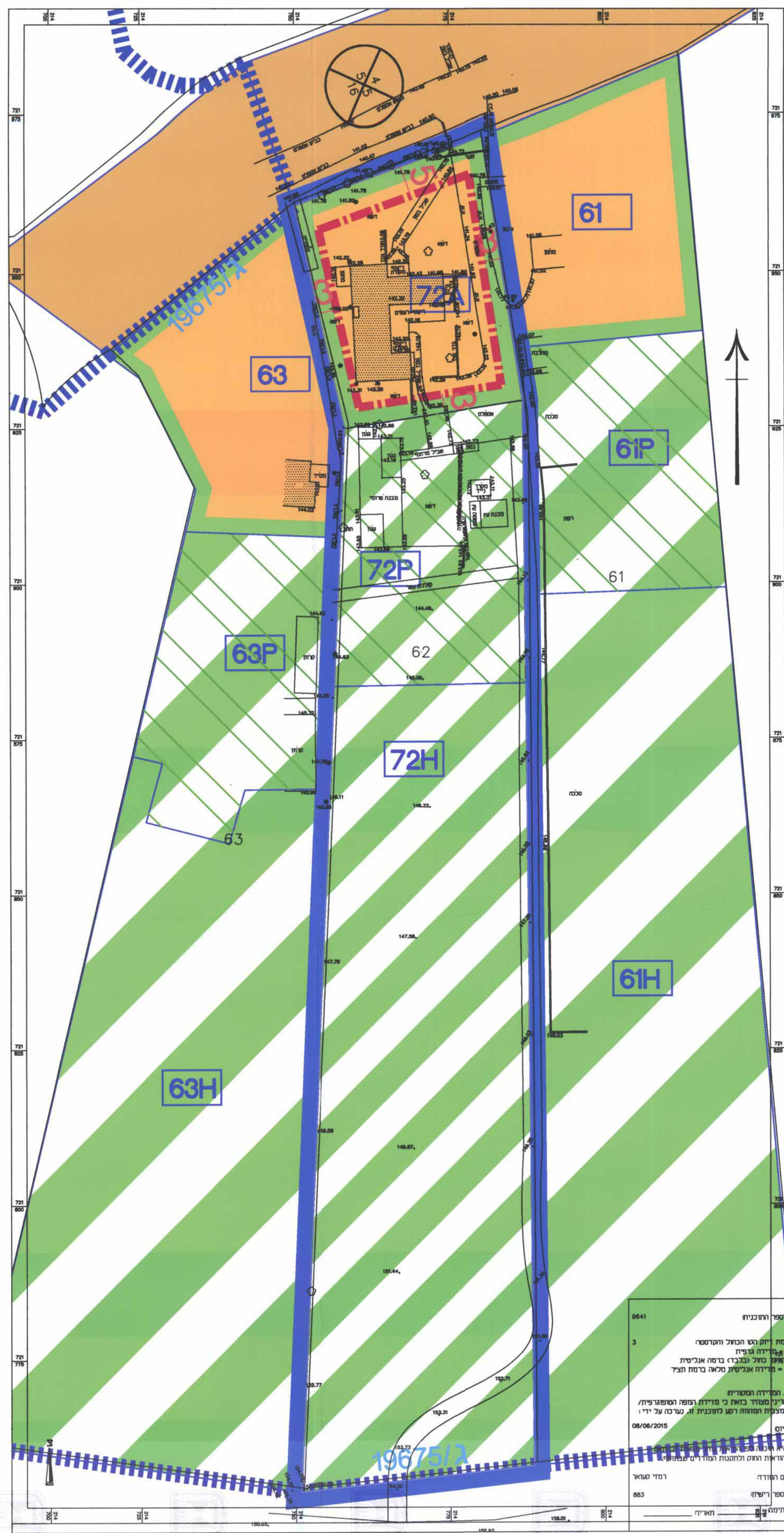
תכנית מצב מאושר קני"מ 1:500

מספר התכנית 9641 שטח 3 מספר רישוי 883 תאריך 08/06/2015 התכנית מאושרת על פי תנאי המסמך המצורף ועל פי תנאי המסמך המצורף ועל פי תנאי המסמך המצורף ועל פי תנאי המסמך המצורף