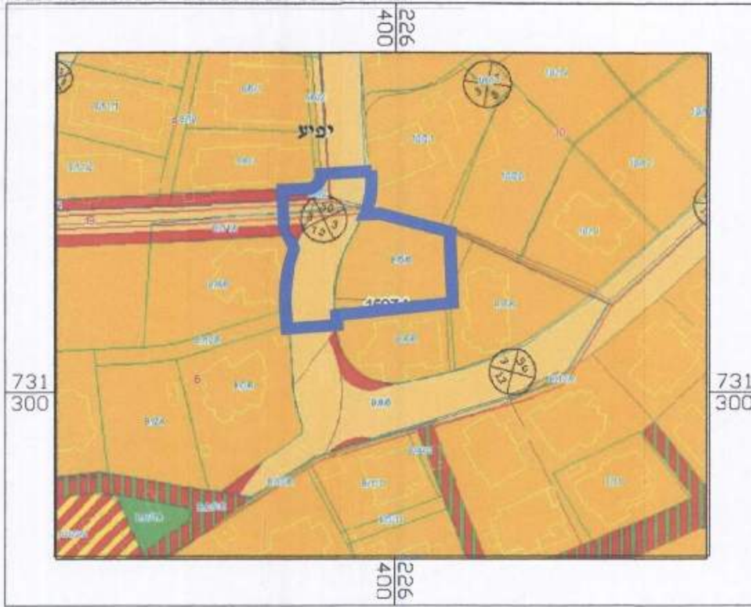
תרשים סביבה קני"מ 1:1250