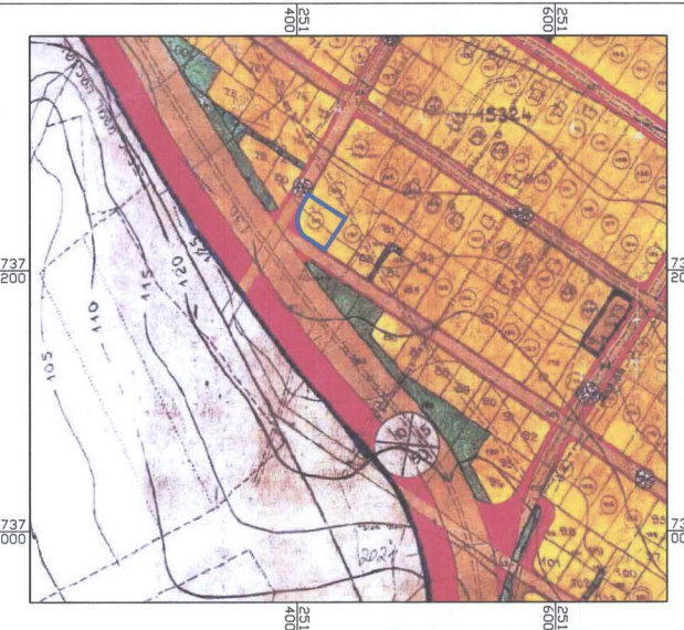
תרשים סביבה קנ"מ 1:2500 תכנית מס' ג/2266