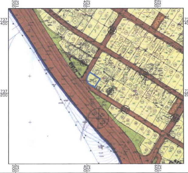
תרשים סביבה קנ"מ 1:2500 תכנית מס' ג/2266