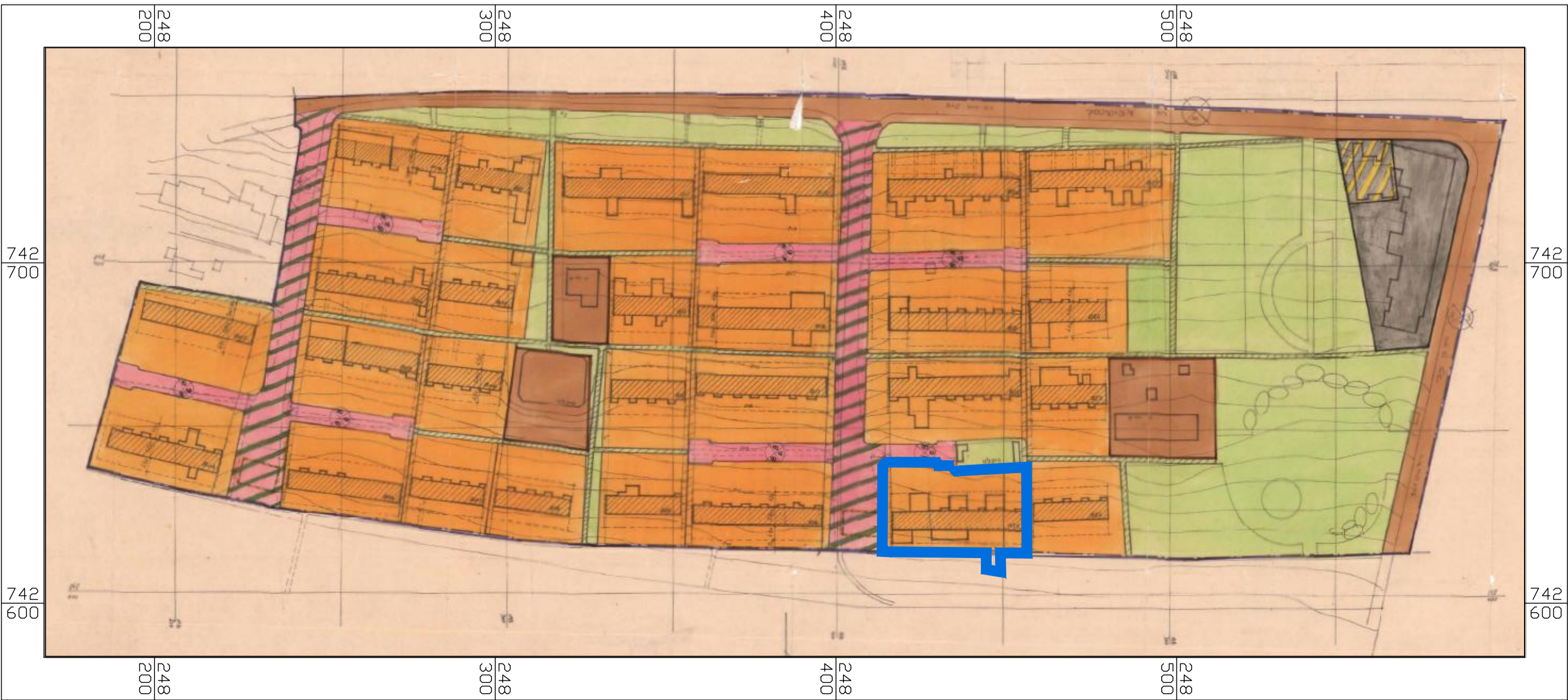
תרשים סביבה קנ"מ 1:2500 תכנית מס' ג/5987

חוק התכנון והבנייה, התשכ"ה - 1965 תכנית מפורטת