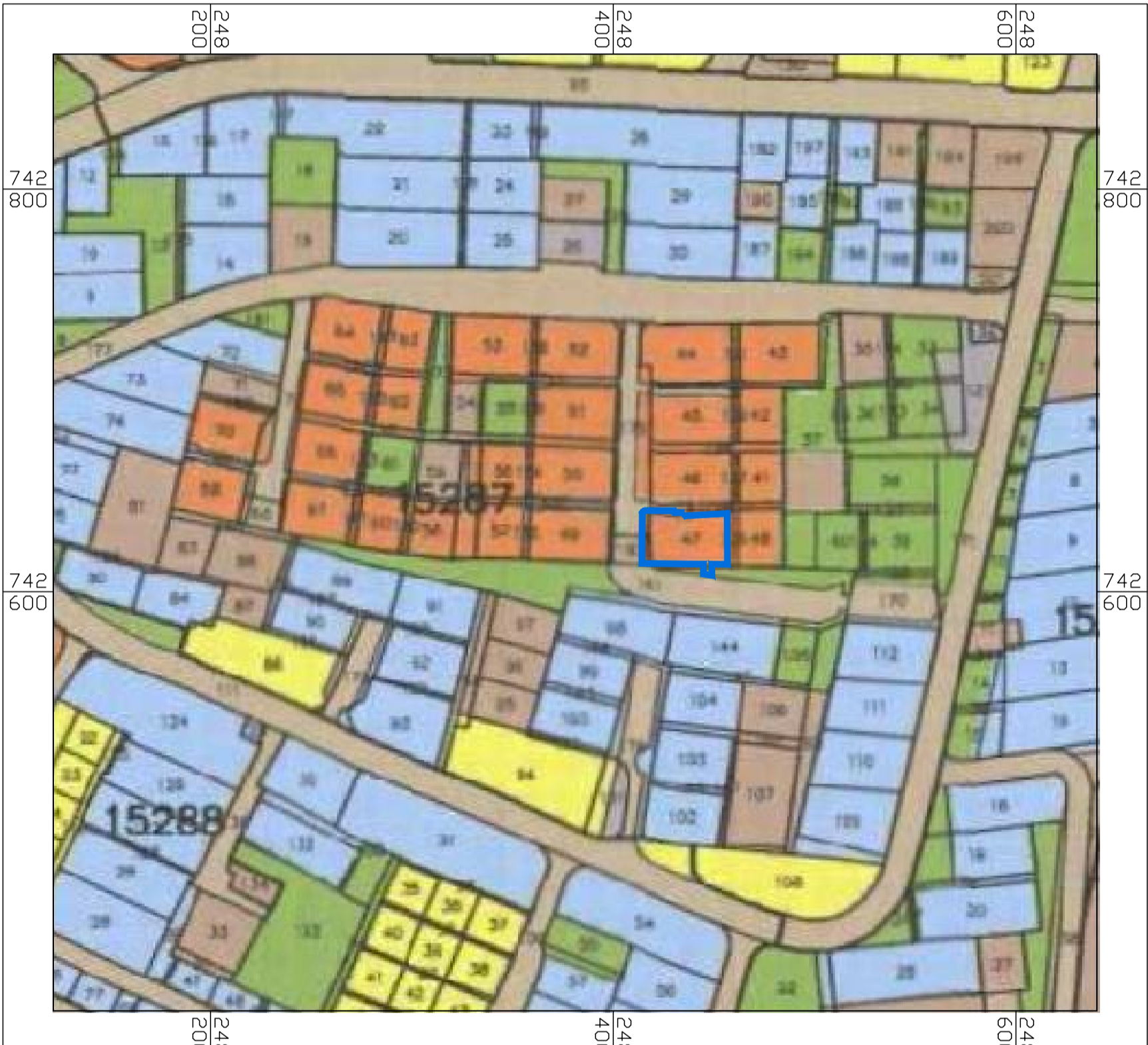
תרשים סביבה קנ"מ 1:2500 תכנית מס' ג/1507