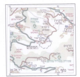
תרשים סביבה קנמ 1:50000

הודעה על אישור תכנית מס' מוסדה בליקטס תרשים מס' 14.01.2018 מיום 14.01.2018 חתום על אישור תכנית מס' 255-0291963 מוסדה בליקטס תרשים מס' 14.01.2018 מיום 14.01.2018