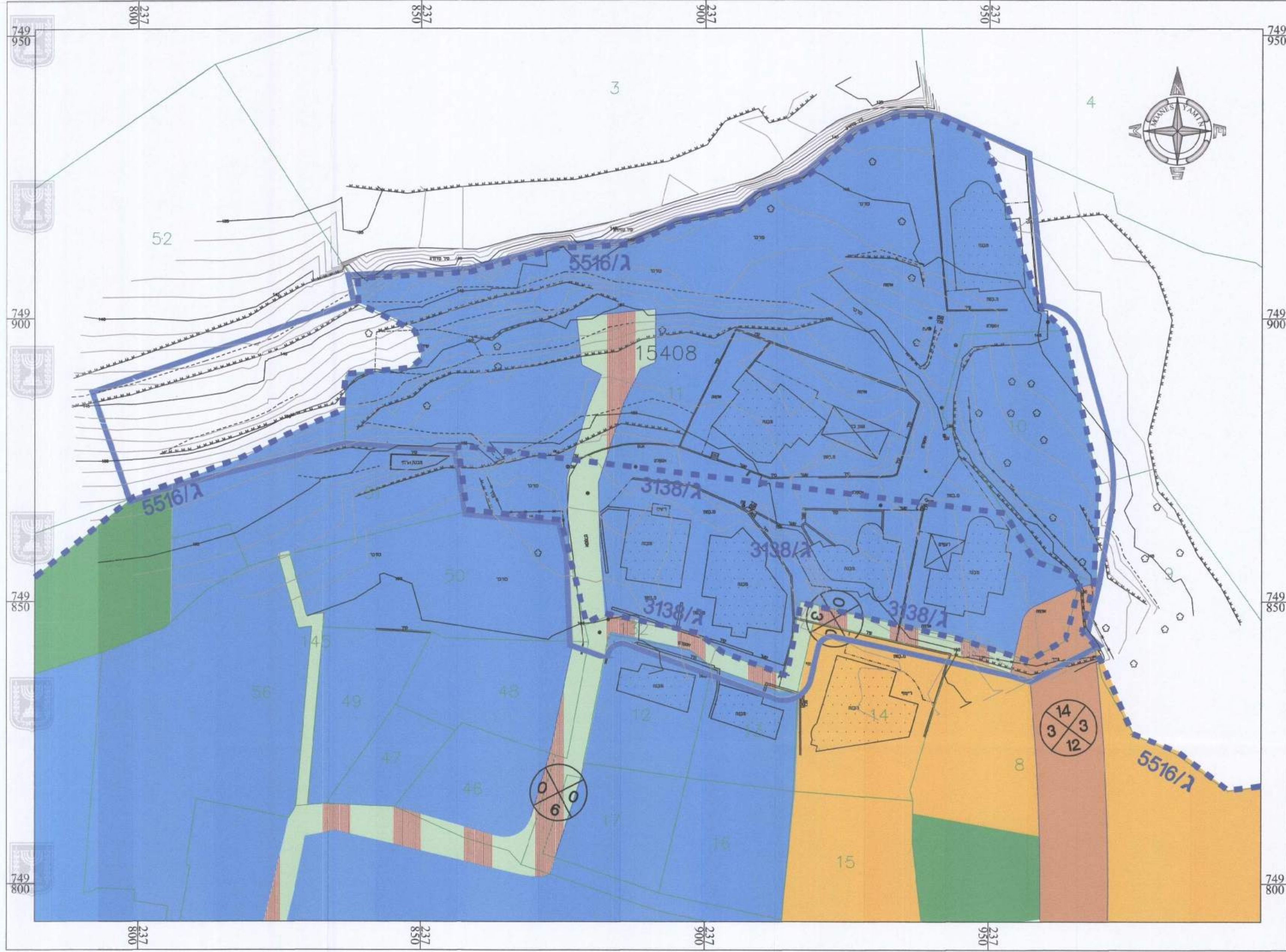
מצב מאושר קנ"מ 1 : 500