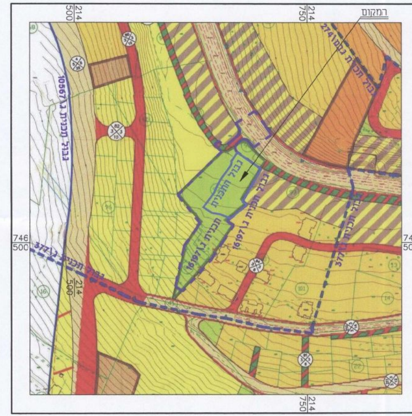
תרשים סביבה לפי ג' 10567 קני"מ 1:2,500