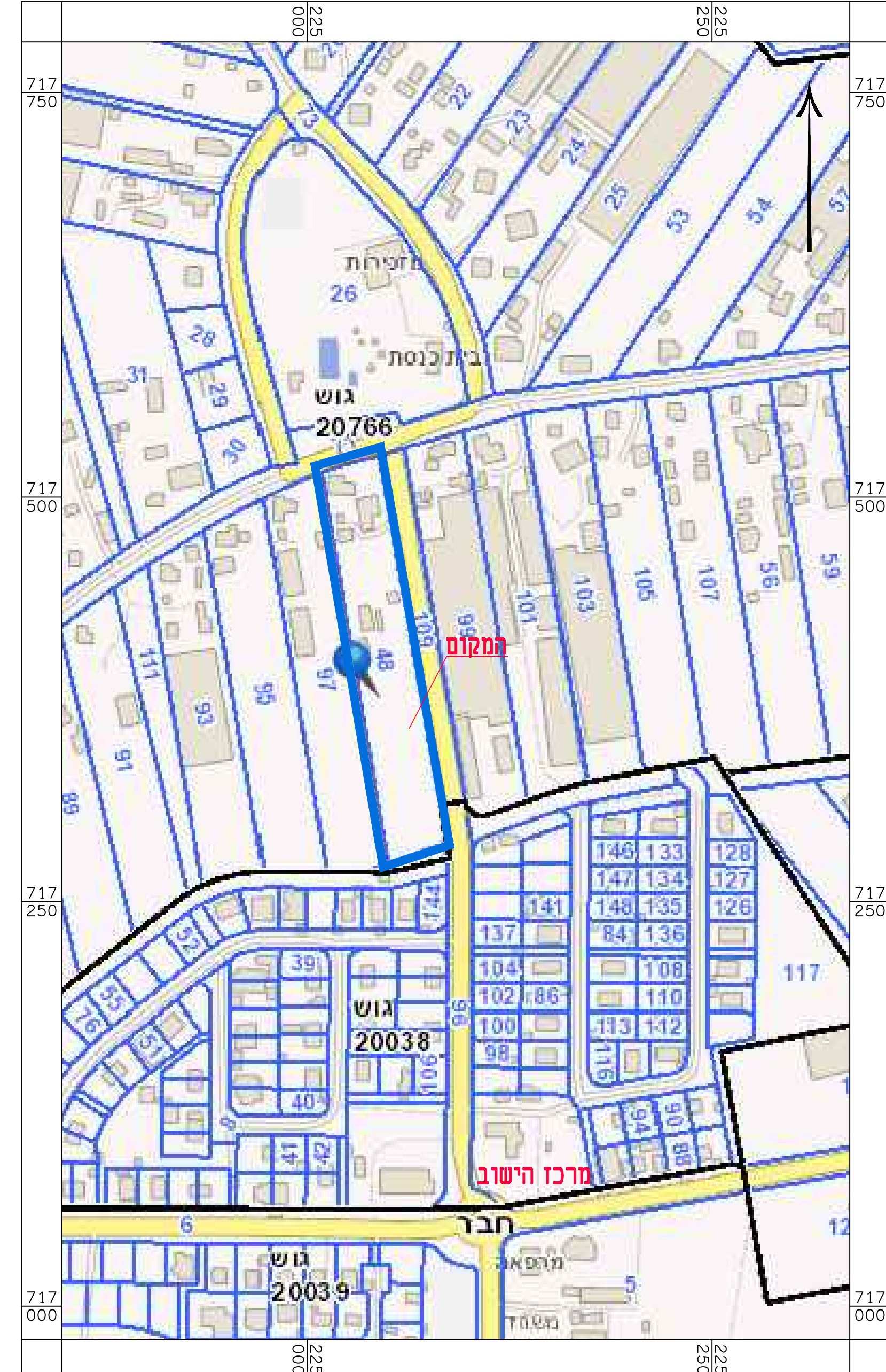
תרשים הטיבה לפי גושים וחלקות קני"מ 1:2500