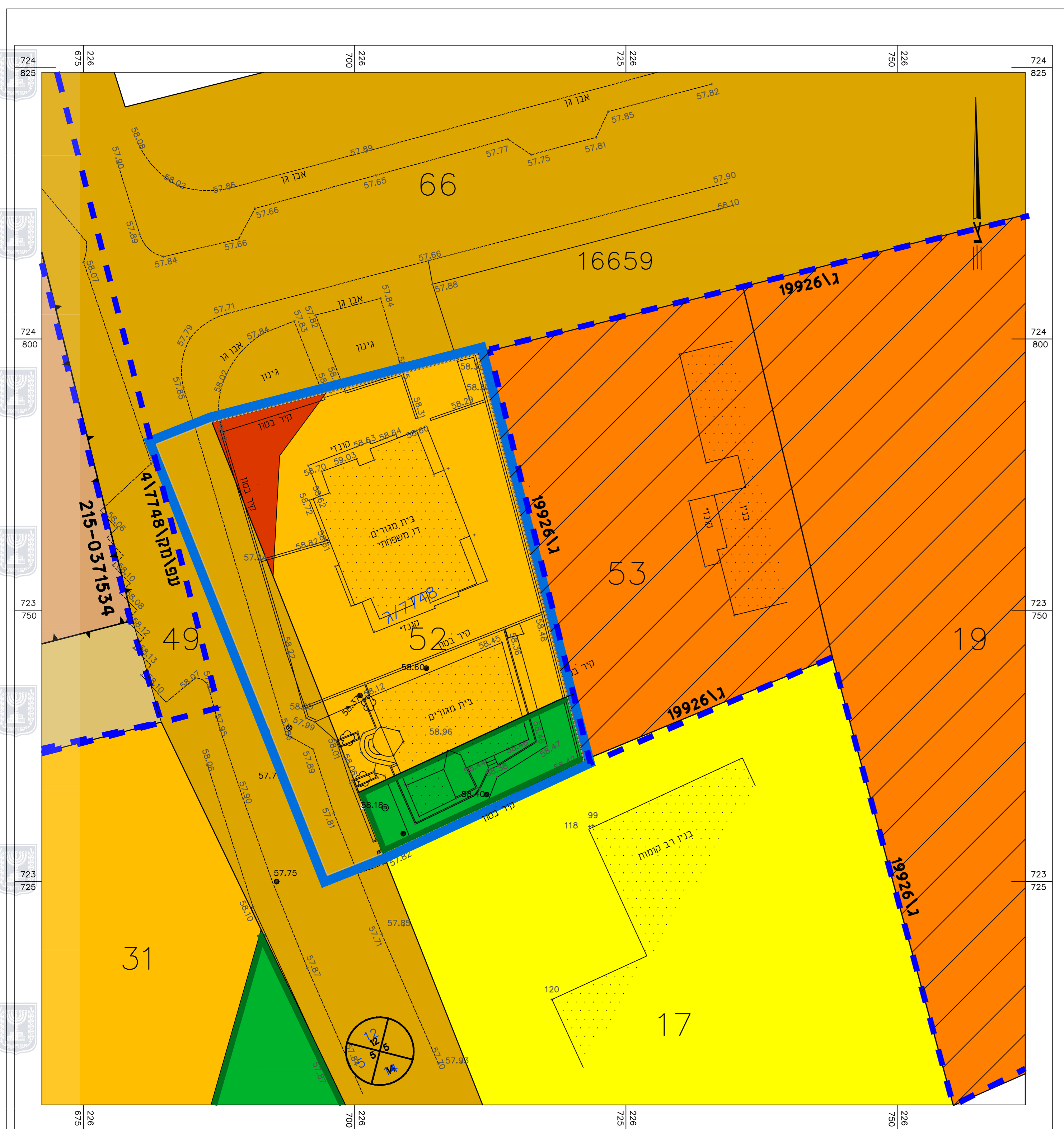
מצב מאושר קנ"מ 1 : 250