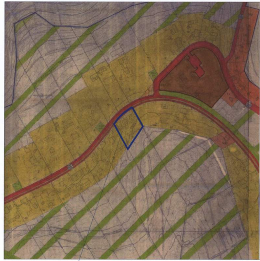
תרשים הסביבה קנ"מ 1:5000 ע"פ תכנית א/2731

עורך תוכנית: מונדר סיבאני שם: מונדר סיבאני תאריך: משרד הנדסה אדריכלות ובניין ר"מ 24798