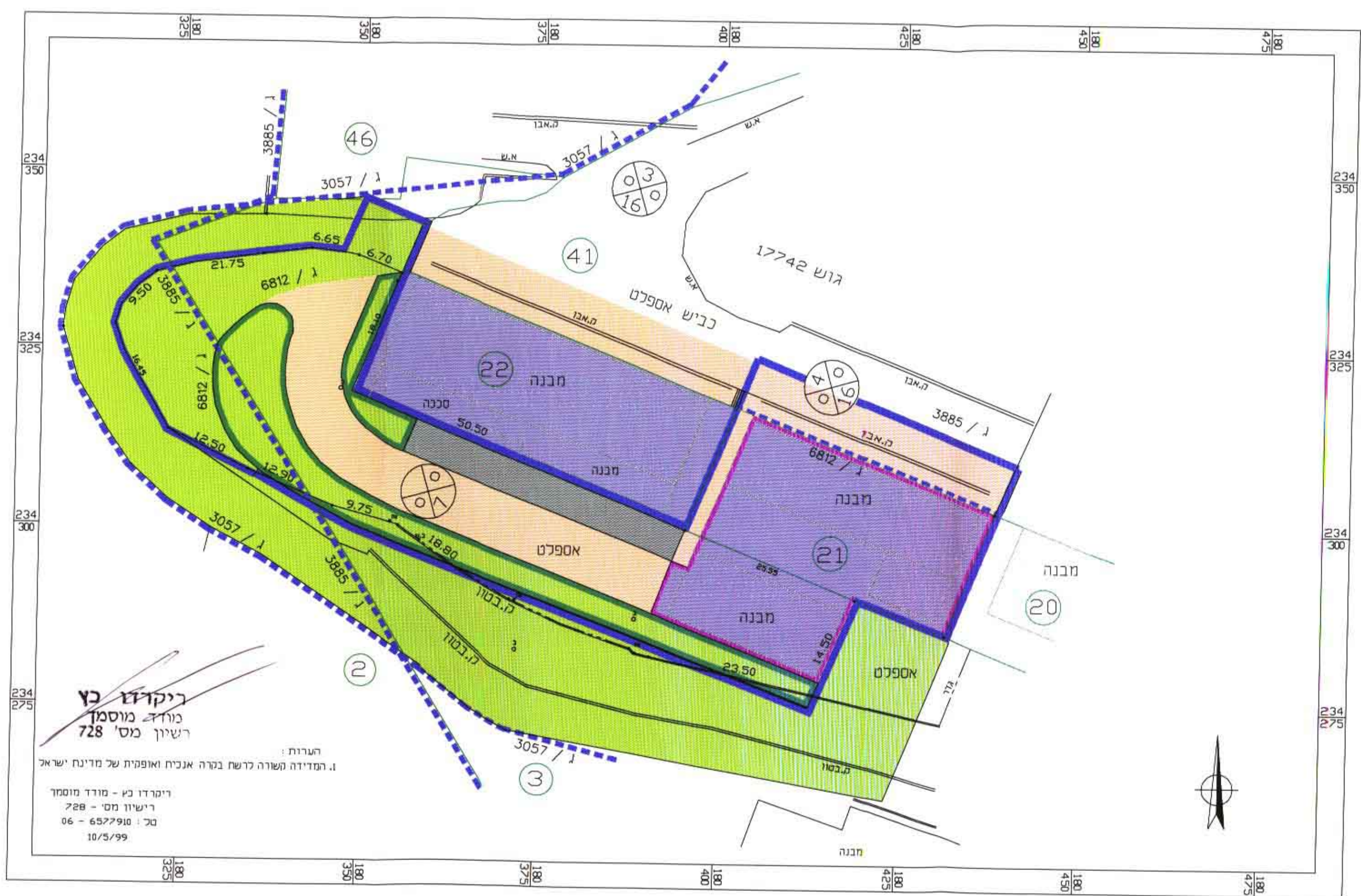
מצב קיים קני"מ 1:500