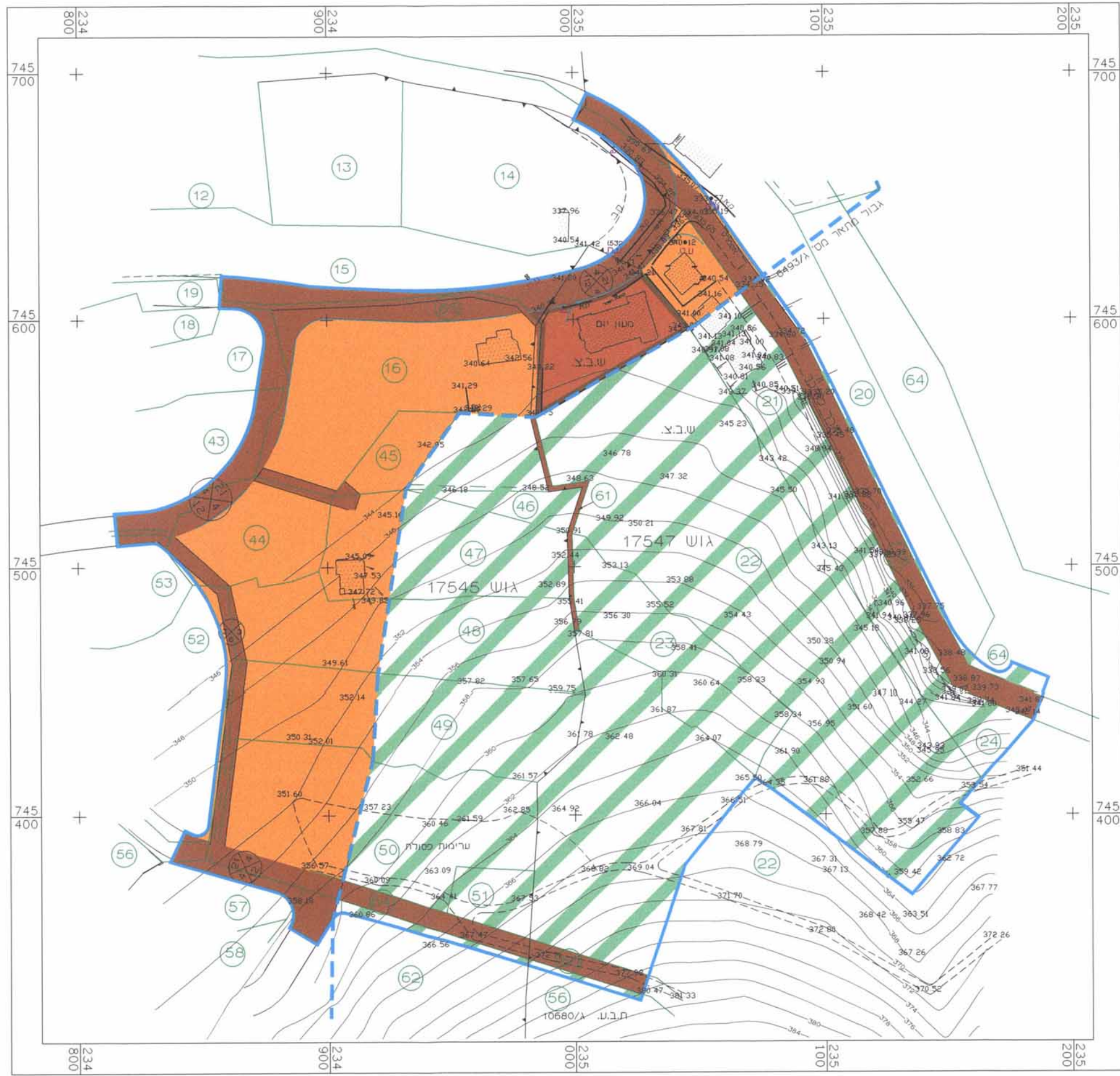
מצב קיים קנ"מ 1:1250

התכנית ערוכה על רקע תכנית מודר מוסמך מוחמד שעבאן מר 67 - מיום 20/12/2018 חתימת מודד: