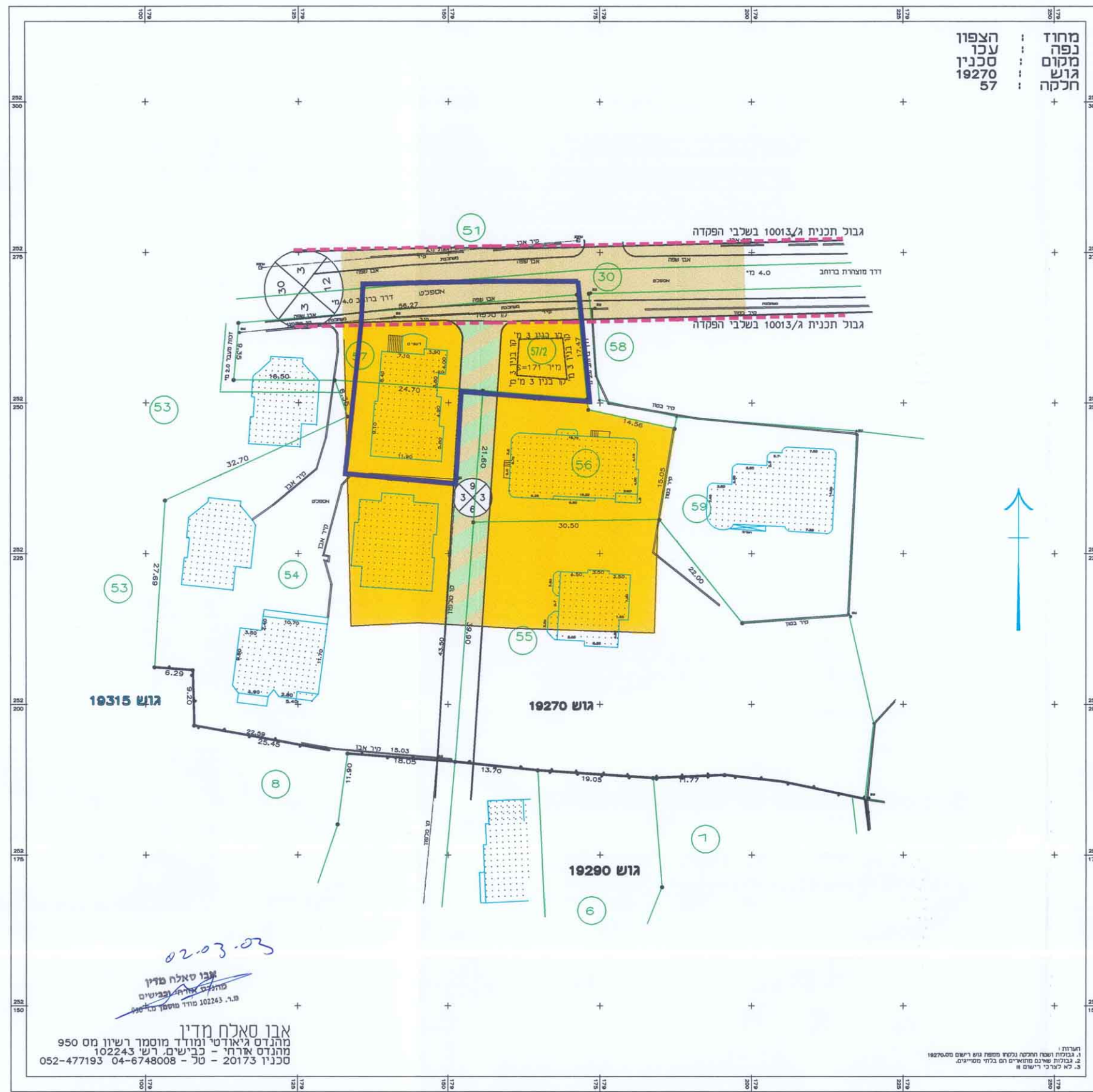
מצב קיים 1:500