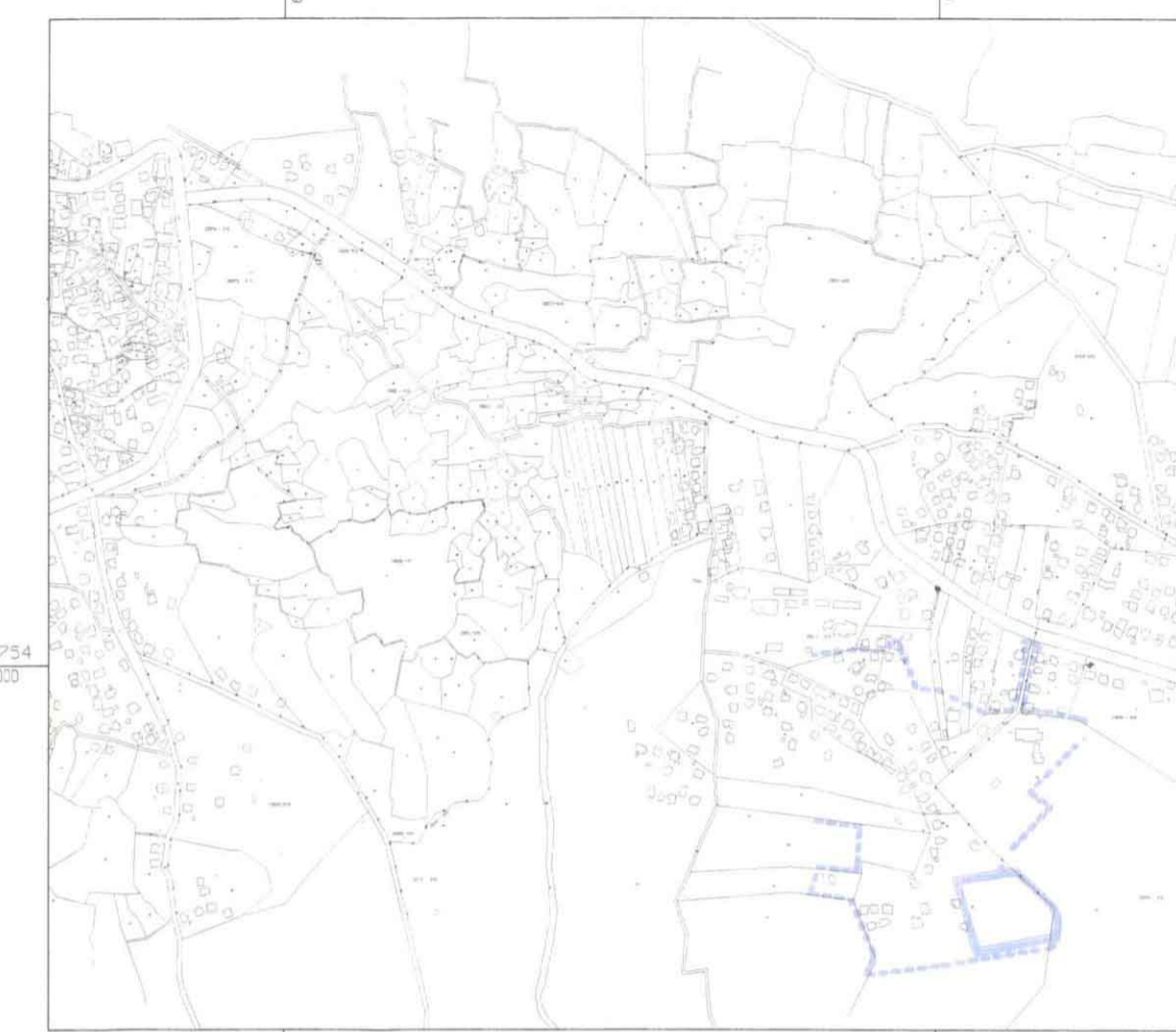
תרשים הסביבה קנ"מ 1:100000

מחוז הצפון מרחב תכנון מקומי: הגליל המזרחי תחום שיפוט מוניציפלי: מגאר תכנית מתאר מקומית מסי ג/12871 המהווה שינוי לתכנית מסי ג/6516