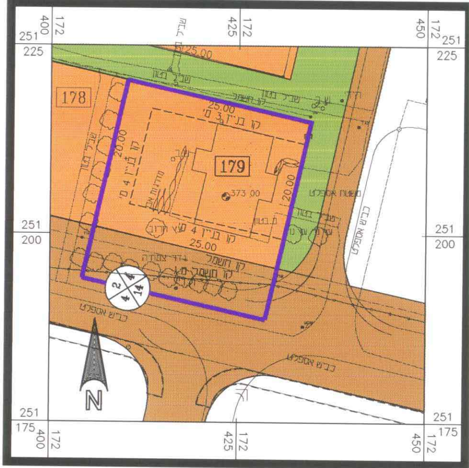
תכנית מצב קיים קנ"מ 1:500