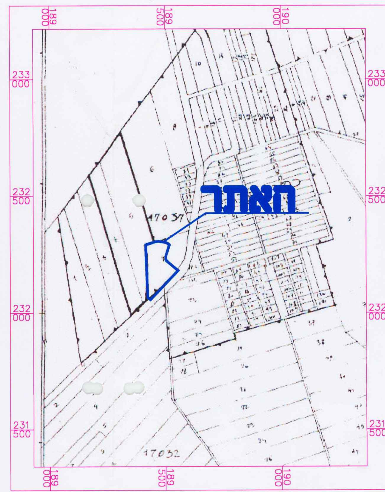
תרשים סביבה ק.ג.מ 1:10000