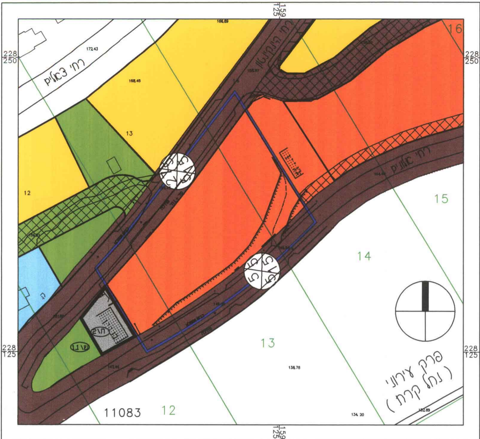
תכנית מצב קיים ק"מ 1:1000