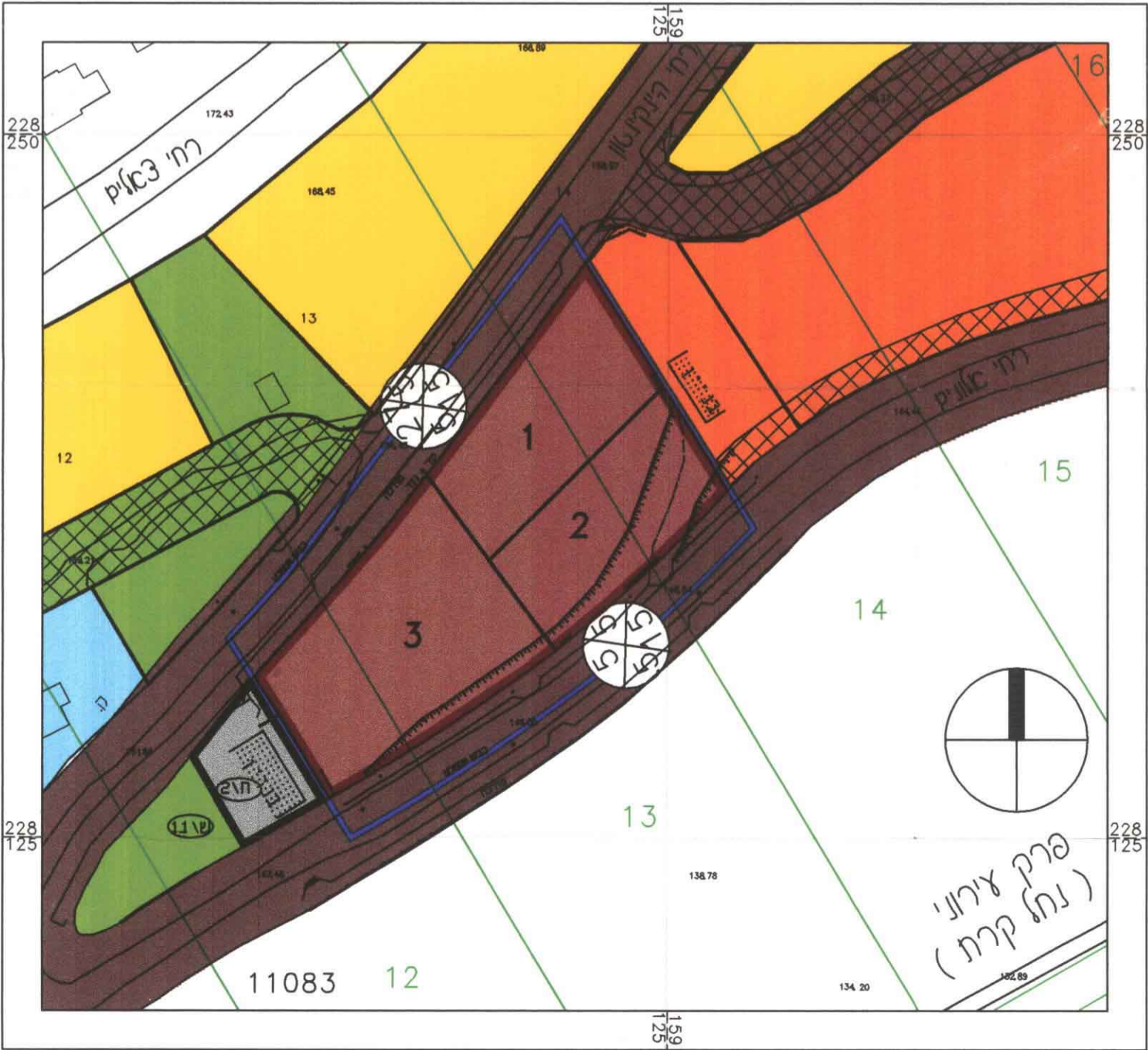
תכנית מצב מוצע ק"מ 1:1000

אדרי' מייק טקה מהנדס המועצה המקומית 21.10.1996 יוקנעם עלית