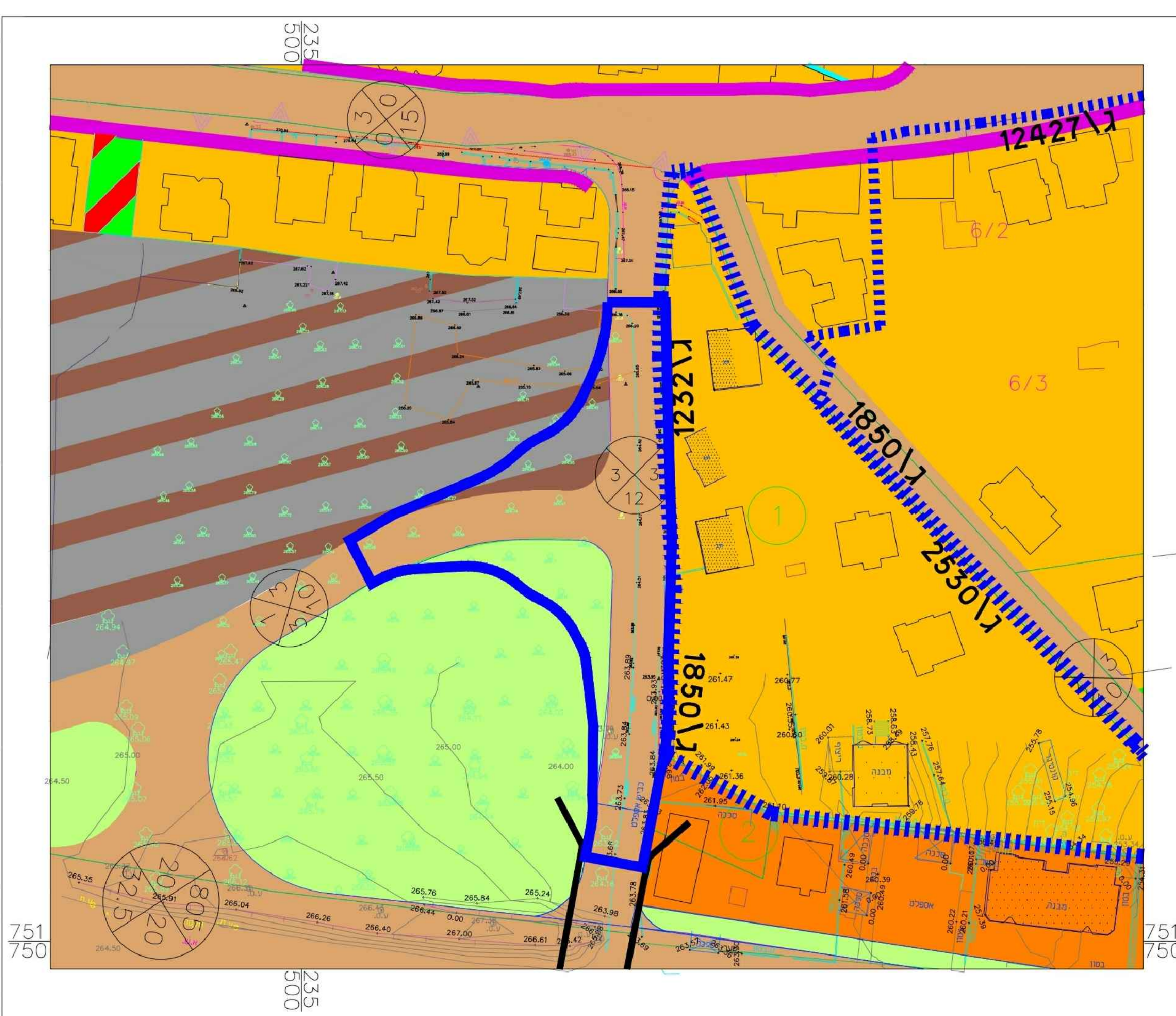
מצב מאושר קנ"מ 1500"