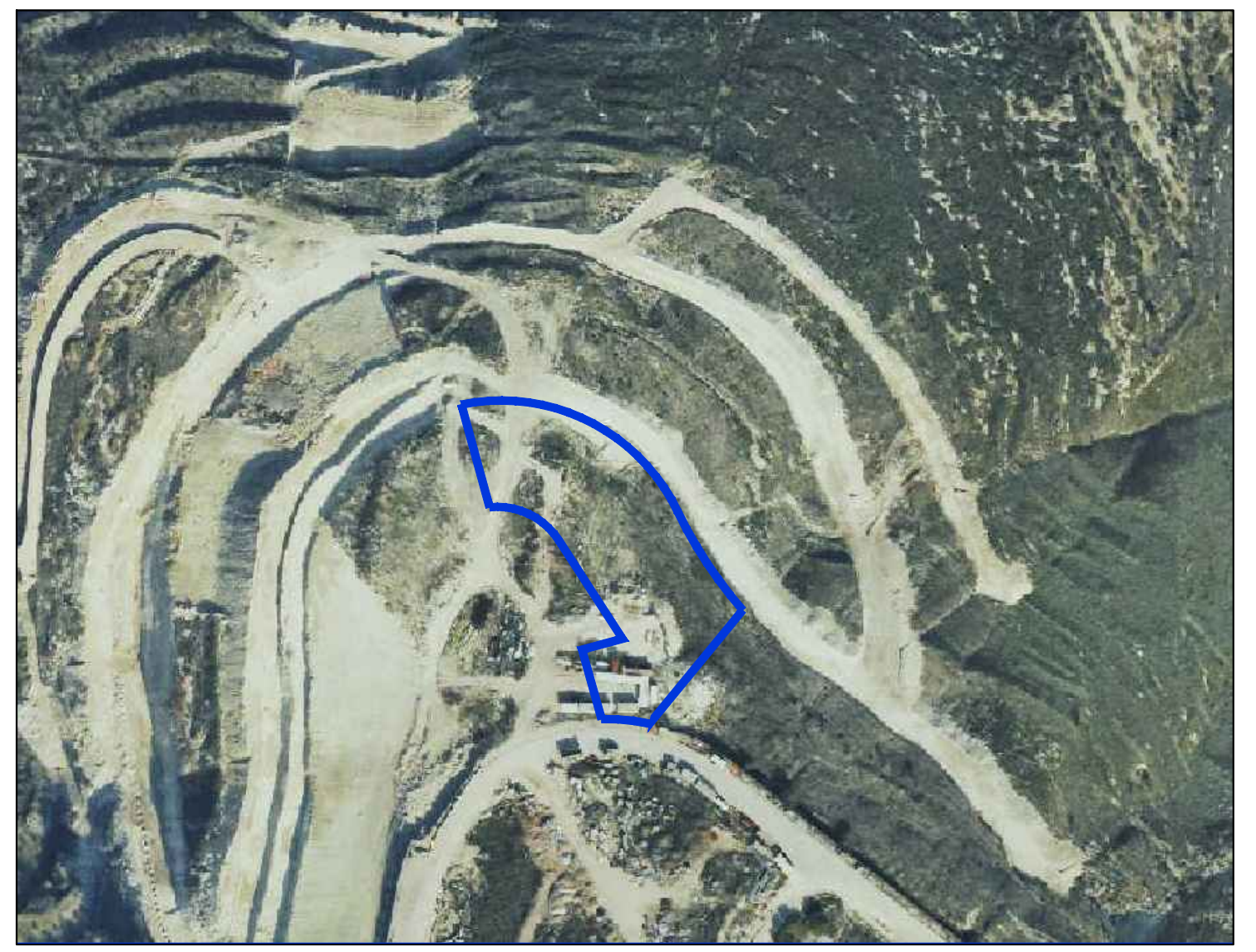
תרשים התמצאות קנ"מ 1:2500