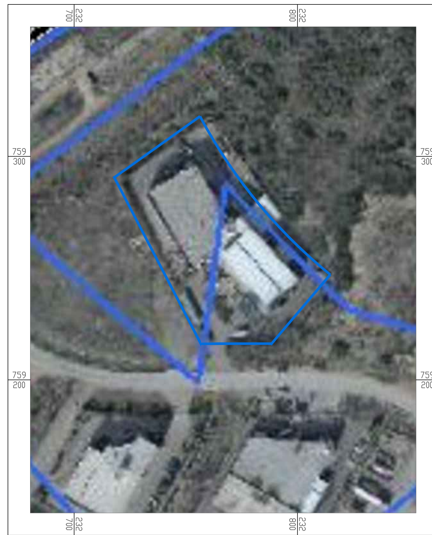
תרשים סביבה קנ"מ 1:1000