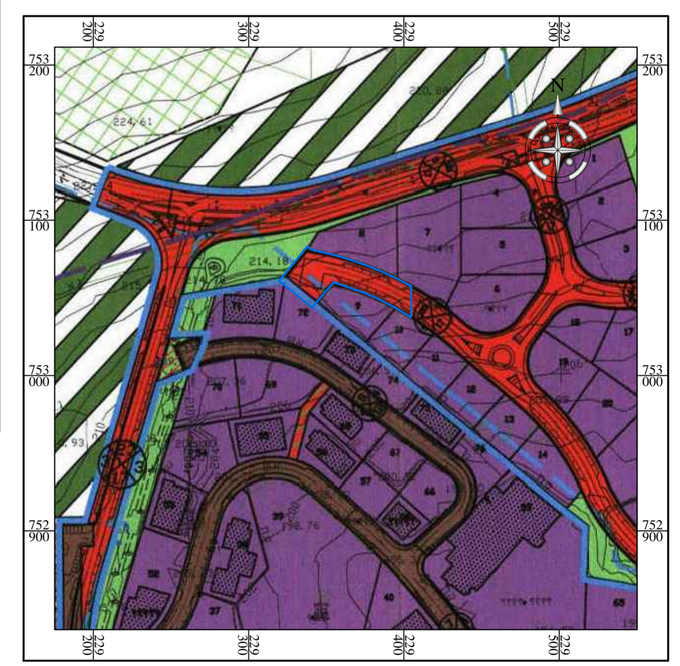
תרשים סביבה קנ"מ 1:2500 עפ"י תכנית מס' ג\13011