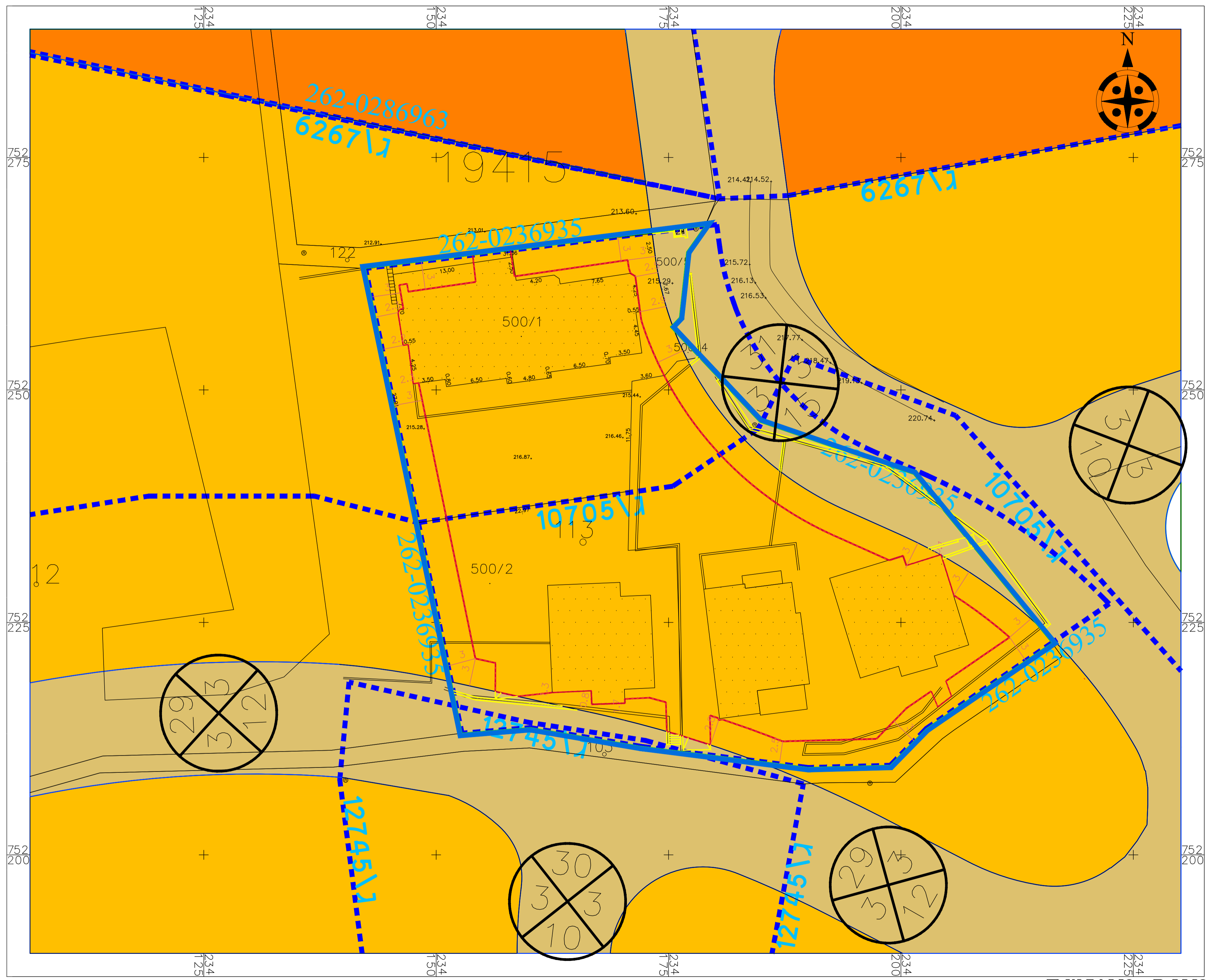
מצב מאושר קנ"מ 1:250