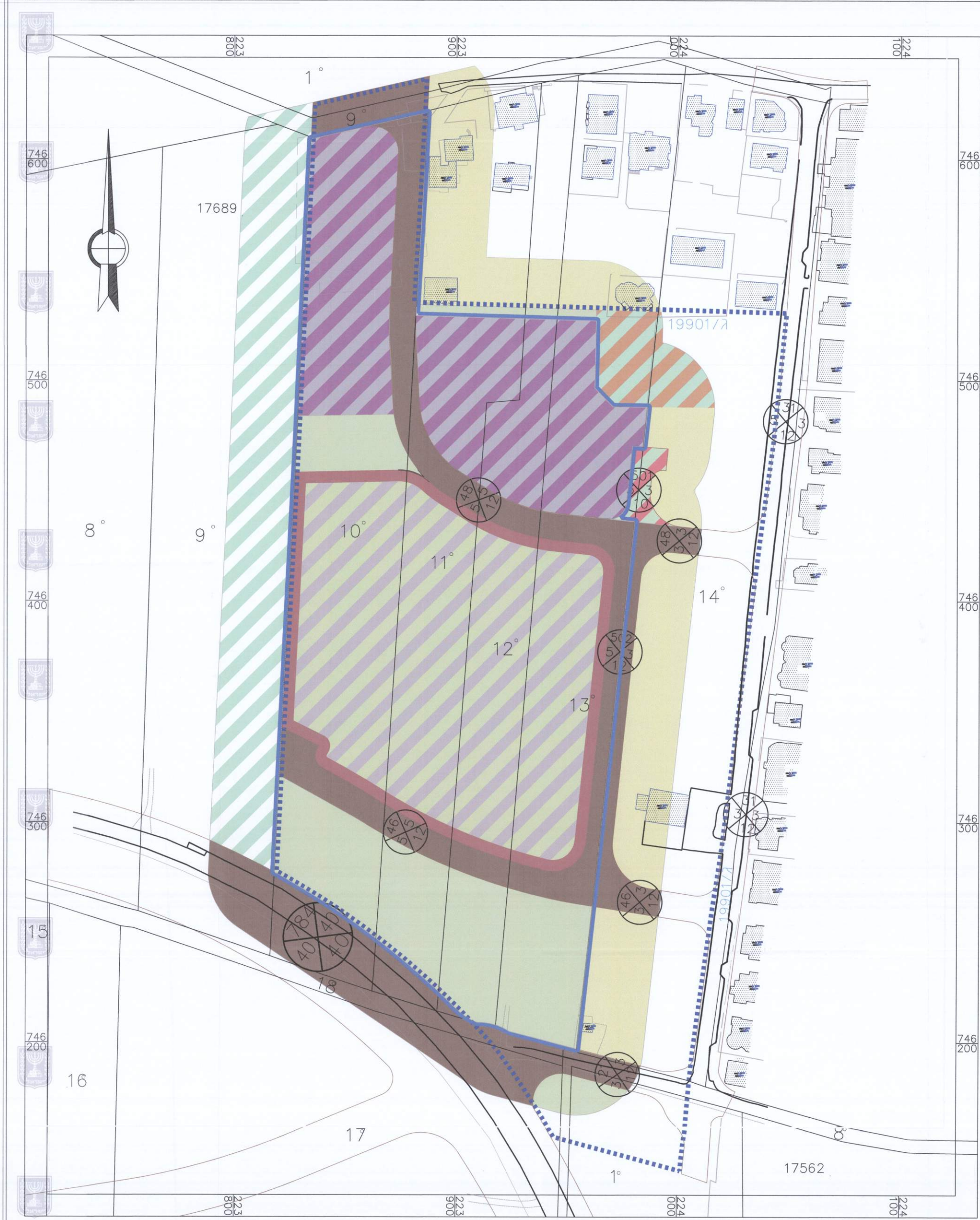
מצב מאושר קנ"מ 1 : 1000