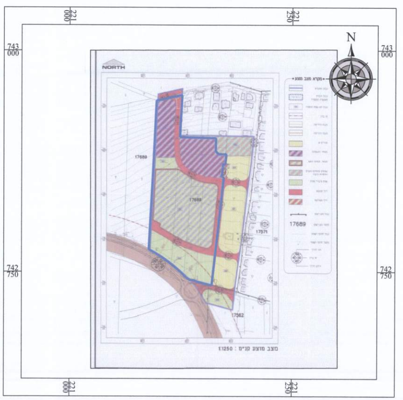
תרשים סביבה קנ"מ 1:5000 תכנית מסי 199017