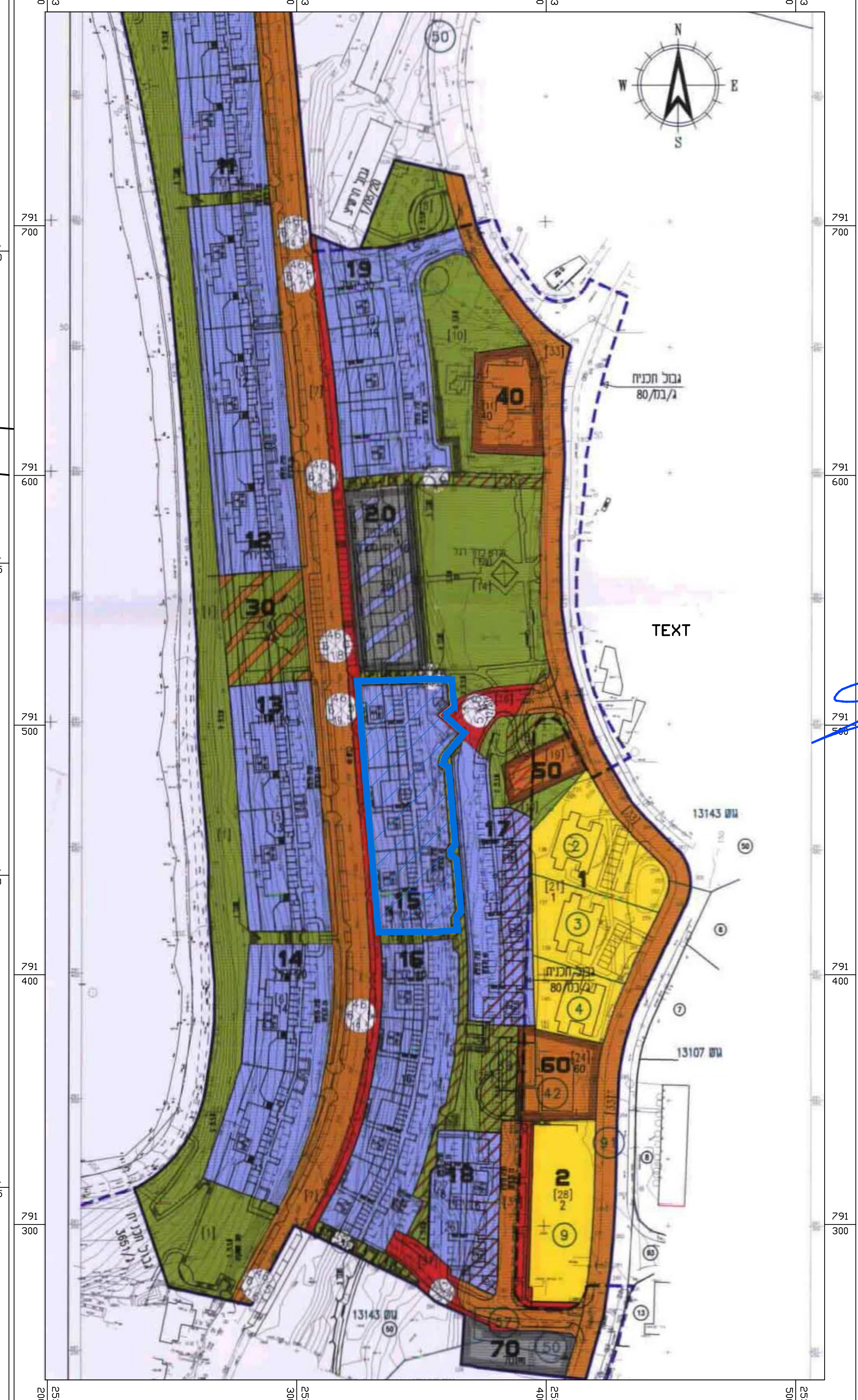
תרשים סביבה קני"מ 1:1250 לפי תכנית ג/ 9948

שמות ודחיתות: עורך הנספח: אוריאל בריק פאנגוב מנהל: אוריאל בריק פאנגוב תל: 052-5546214