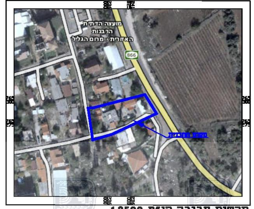
תרשים סביבה קנ"מ 1:2500

חוק התכנון והבנייה, התשכ"ה - 1965 תכנית מתאר מקומית