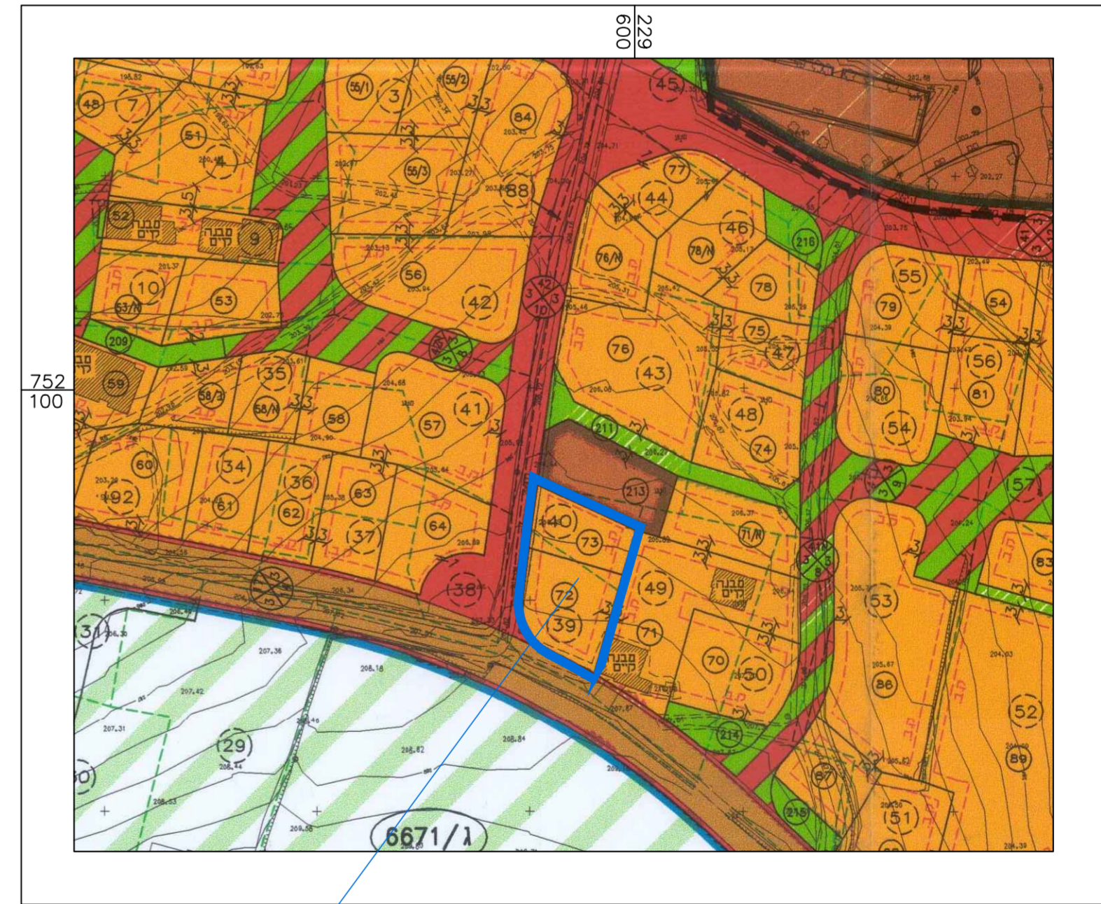
מקום התכנית תרשים סביבה קנ"מ 1:1250 על רקע תכנית ג/12049